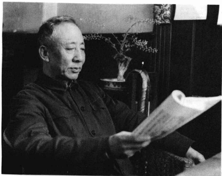
一九八〇年摄于天津寓所