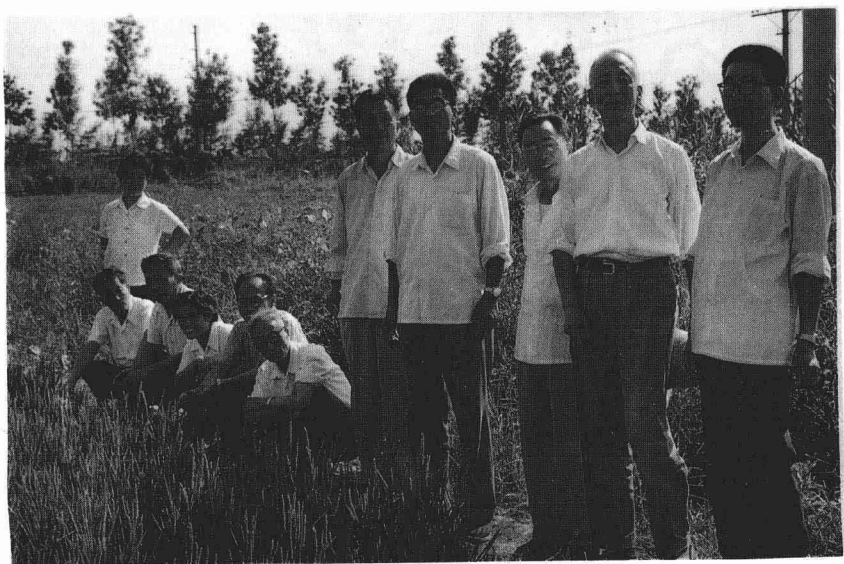
一九八一年九月三日在天津北郊与 参加文集编校工作的同志们合影