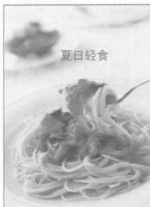
从罗勒里提取绿色