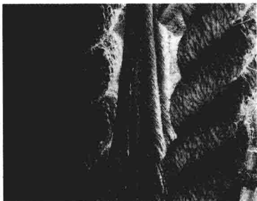
充满艺术美感的几何图案绳结。

当人类还住在洞穴里的时候，就开始打绳结了。20世纪60年代，美国作家赛勒斯·劳伦斯·德认为史前（也许几百万年前）时期人们就学会了打绳结，当时人们刚学会如何用火和耕地，刚发明了轮子，刚知道如何利用风能。不幸的是，对于绳结没有留下任何有形的证据，有关专家猜测最初的打结材料是藤、动物身体上的肌腱或是成条的生兽皮。