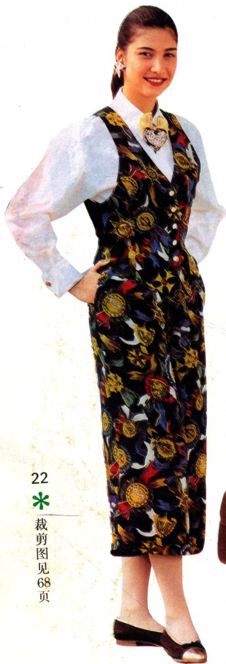
22 * 裁剪图见 68 页