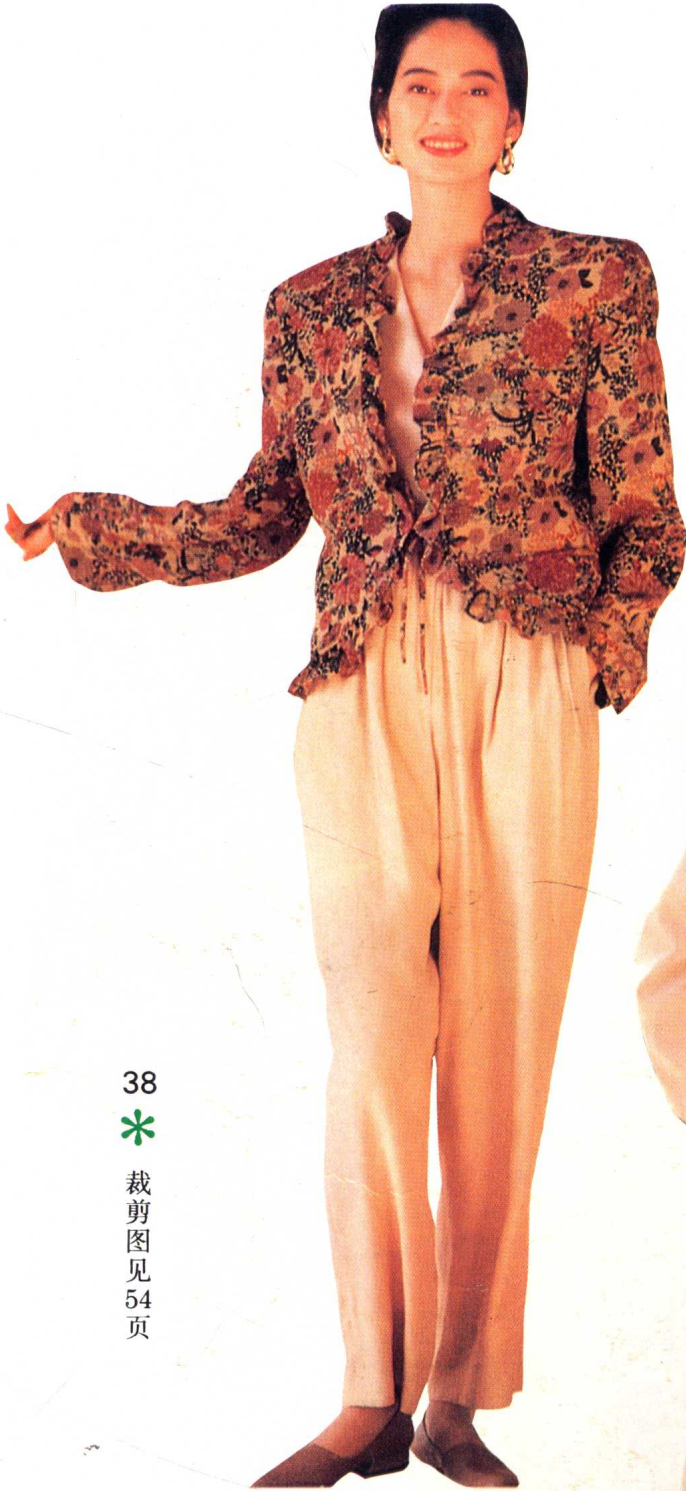
38 * 裁剪图见 54 页