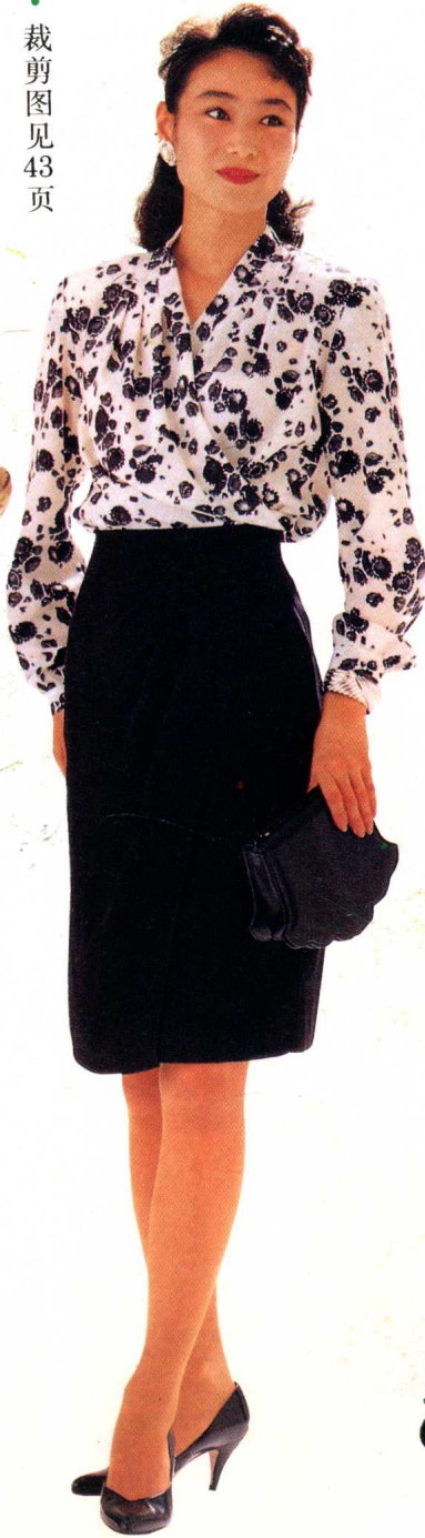
26 * 裁剪图见43页