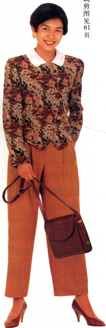
24 * 裁剪图见 81 页