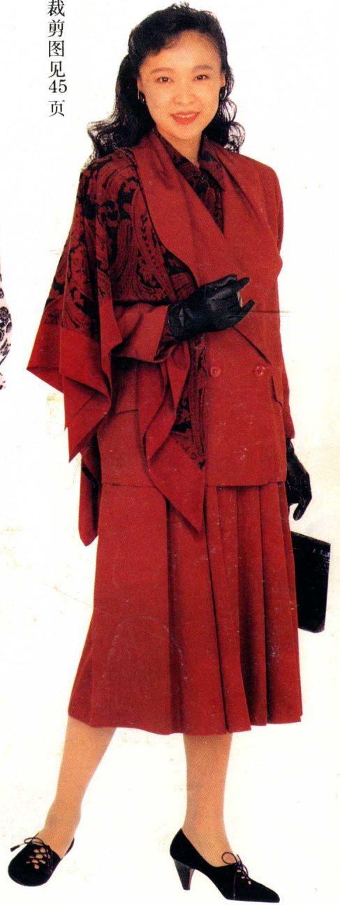
27 * 裁剪图见45页