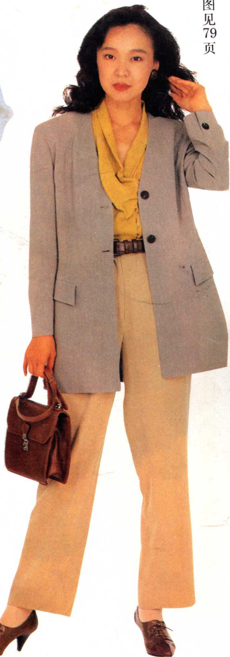
23 * 裁剪图见 79 页