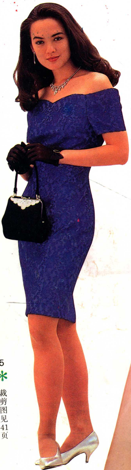
5 * 裁剪图见 41 页