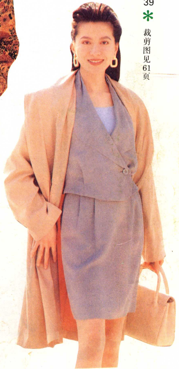
39 * 裁剪图见 61 页