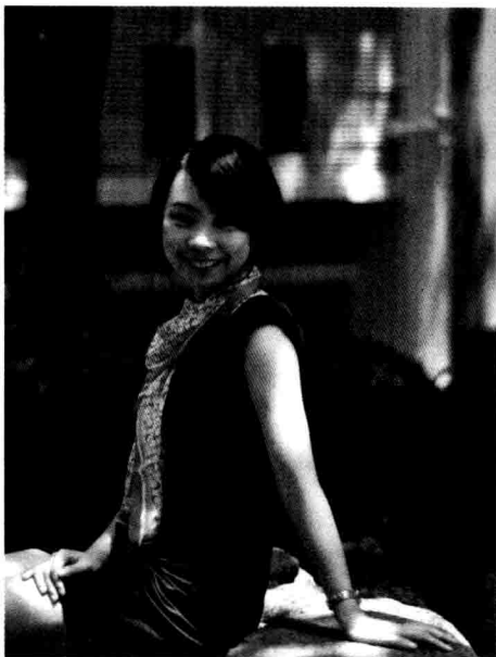
2012年8月，于香港大学荷花池边

是我心中燃烧的梦想。 〔1〕 导师听完我的回答后，当时并没有任何回应，而是在我入学不久后的一次论文研究探讨中，提点我说：你的论文是要为整个研究领域作出贡献，而不仅仅为了中国。他的话令我重新去反思我作为一名中国学术研究人员个人价值。“我想为中国的数学教育作贡献”——这确实是初踏上香港这片国际化土壤的我发自内心的声音。逻辑很简单，因为中国在数学教育领域发展滞后，所以我想用学到的新知识和新技术促进它的发展。可在同时，我却忽视了学术的真正价值，学术是世界性的，是无国界的，那是将个人的学识和智慧学术用规范方法和语言来传播，贡献给我们共同的学术领域。我来自中国内地，我的研究自然带着中国教育的