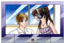
actor 男演员 actress 女演员

词汇拓展 ▶ 后缀 -ess, 表示“女的, 雌性的” host 男主人—hostess 女主人/master 男主人—mistress 女主人/Prince 王子—Princess 公主/emperor 皇帝—empress 女皇/ waiter 男侍者—waitress 女侍者/steward 男乘务员—stewardess 女乘务员/ambassador 男大使—ambassadress 女大使/mister 男校长—mistress 女校长