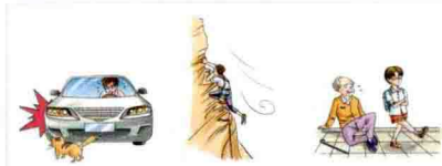
abrupt 突然的; 意外的 abrupt 险峻的; 陡峭的 abrupt 粗鲁的; 莽撞的

adj. ① 突然的; 意外的 (☑ sudden): This novel has an abrupt ending. 这部小说的结局出人意料。② 险峻的; 陡峭的 (☑ steep): We climbed down an abrupt descent. 我们爬下了陡峭的斜坡。③ 粗鲁的 (☑ impolite); 莽撞的: The little boy has an abrupt manner. 这个小男孩举止粗鲁。 派生词 abruptly adv. 突然地; 意外地