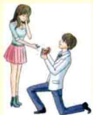
accept (接受) (求婚)