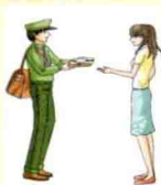
receive (收到) 信件

accept and receive accept 指主动、自愿地接受。 receive 指被动地接到、收到, 指动作本身。如: I received a gift but did not accept it. 我收到了一份礼物, 但是没有接受。