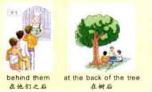
behind them 在他们之后