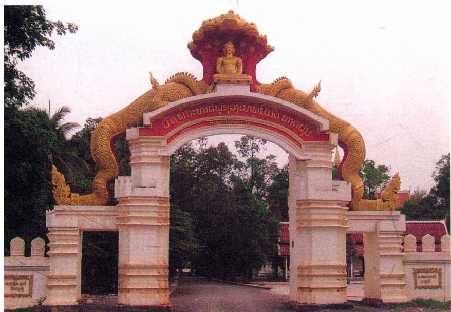
位于万象市中心的灰塔寺的大门 ——龙护佛雕塑