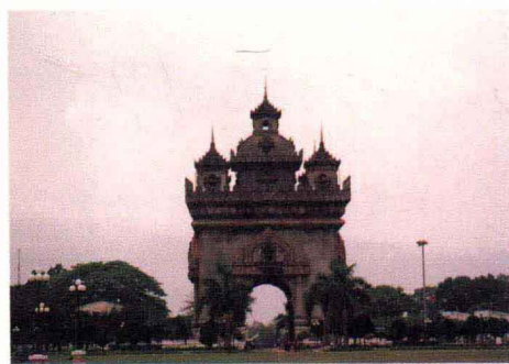
万象市老西合璧的凯旋门