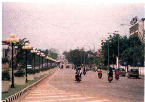
中国援建的万象市澜沧大道