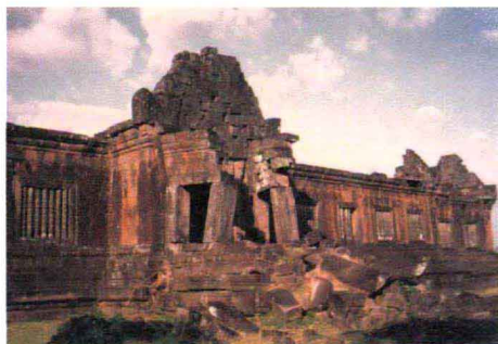
老挝古占巴色王国王宫巴沙遗址