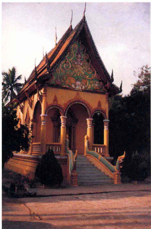
老挝古都琅勃拉邦相通寺（金佛寺） 中的“辛”（镇邪碑屋）