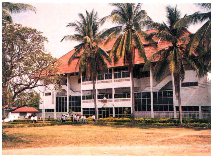
老挝国立大学图书馆