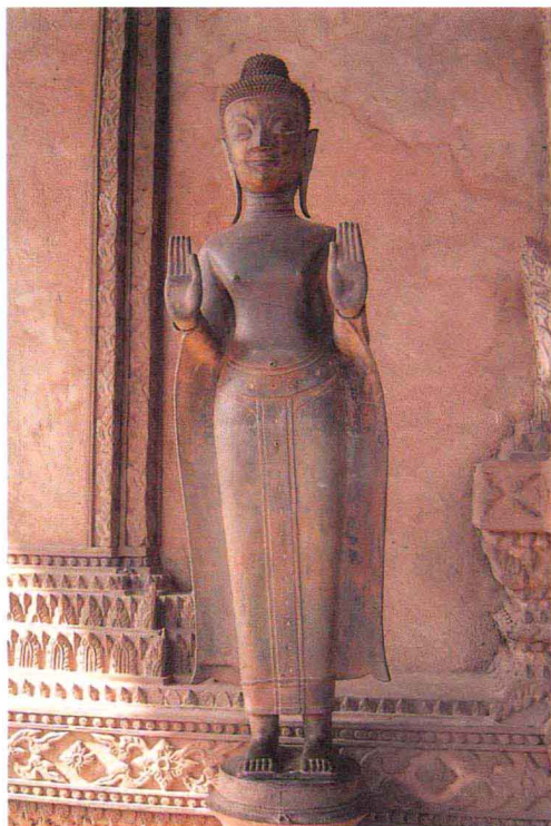
万象市玉佛寺内的立佛像