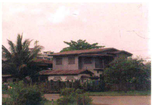
万象市内普通民居