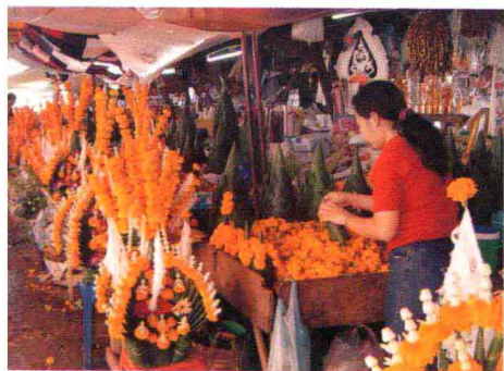
新年前万象市的鲜花市场