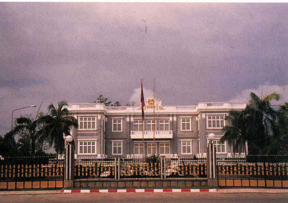
老挝国家主席府——金宫