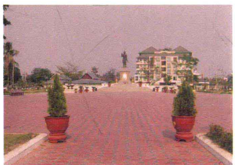
万象市法昂王广场