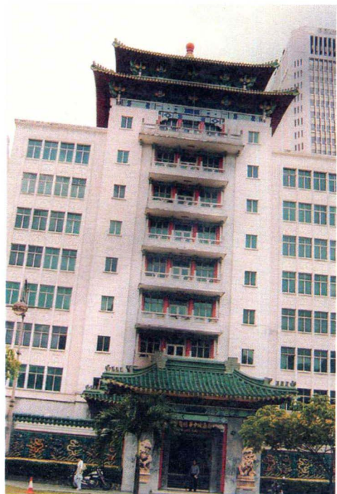
新加坡中华总商会