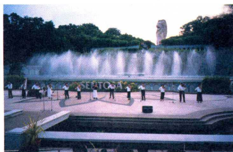
圣淘沙露天音乐会