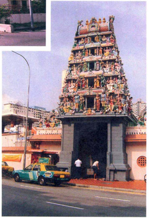
室利玛里安曼印度庙