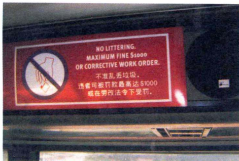
公共汽车上的警示牌