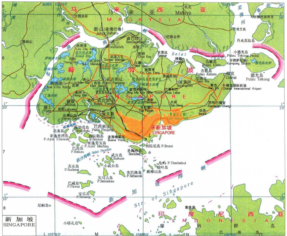
新加坡行政区划图