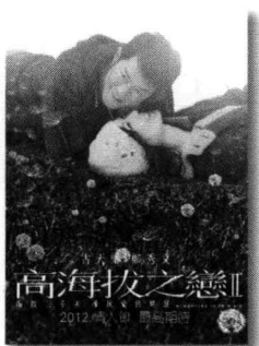
电影《高海拔之恋2》海报

现在的情人节，除了玫瑰、巧克力好卖，电影票大概也成了紧俏礼品。我2月14号晚到电影院看《爱Love》，整个影院里三层外三层围满情侣，几乎所有电影，连第一排的边边角角都坐着人。这种盛况出现的原因，一是情人节看电影是情侣最经济的消费方式；二是近期一些大片正上；三是有几部专为情人节打造电影上映，让电影院温馨满溢。