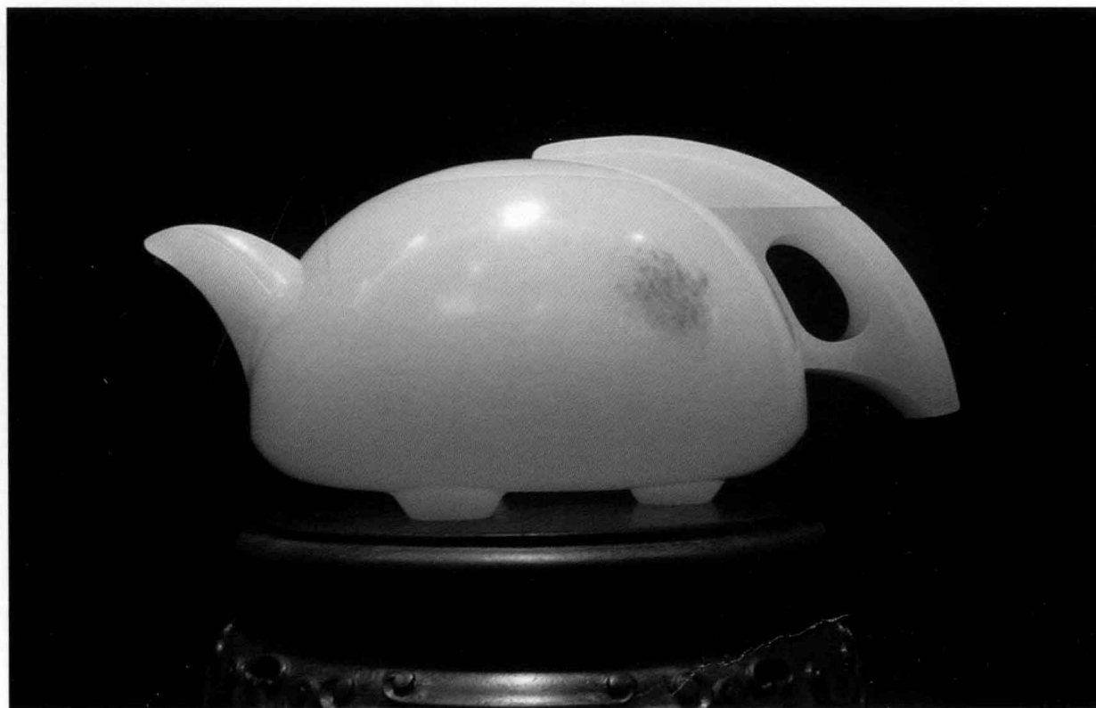
宋鸣放 竹编壶(上) 宋鸣放 飞碟壶(下)