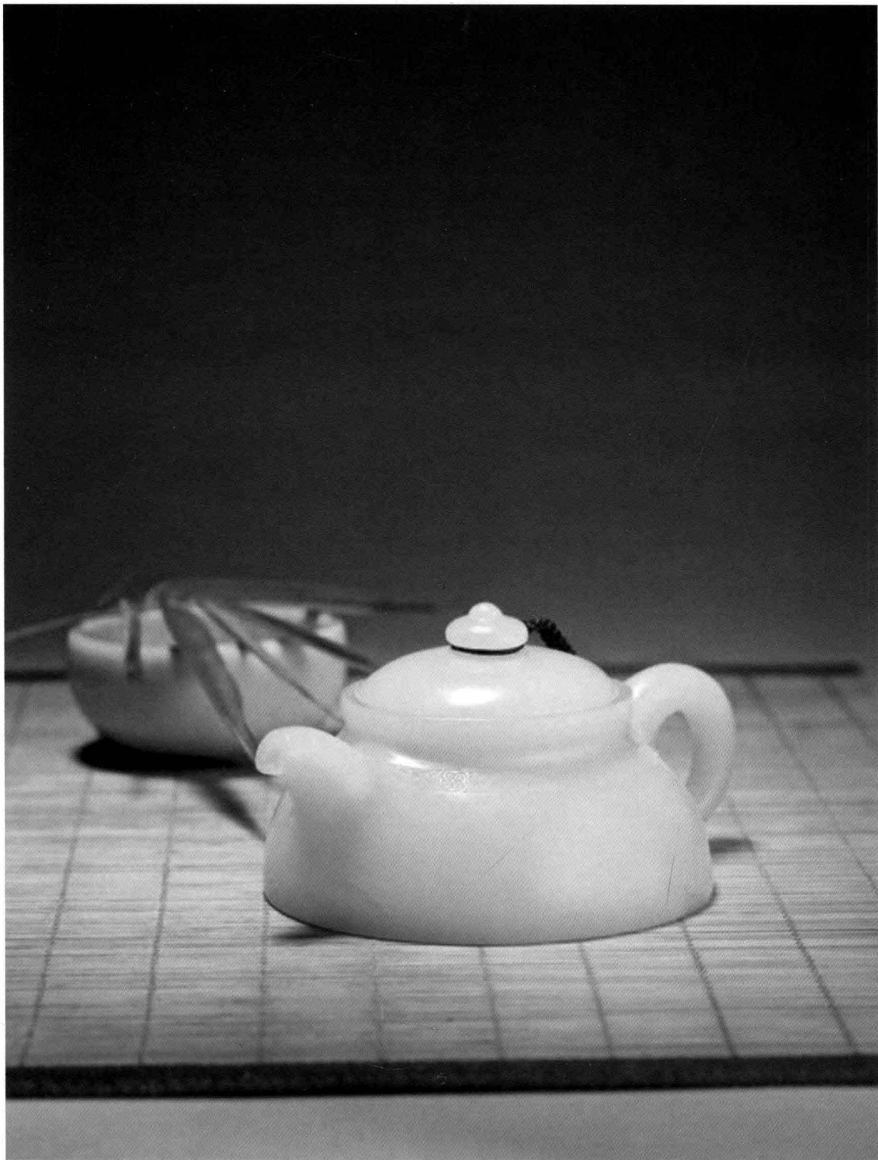
宋鸣放 白玉半月壶