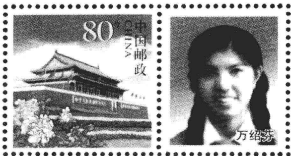
收录纪念建国六十周年《巾帼英雄》邮册

参加革命工作初期，实行的是包干制，衣食住行都是公家供给的，给我的第一套服装是列宁服，穿起来非常精神。我被选调到团市委工作时，那里的干部都很年轻，大多不到20岁，南下的干部也只有二十几岁。书记是1938年参加革命的“三八”式老干部，也不到30岁。在那个“革命人永远是年轻”的年代，大家革命情绪饱满，朝气蓬勃，哪里需要到哪里去。去工厂，晚了就和工人睡在一起；去农村，一去就是多天甚至几个月，带回满头的虱子回来，还开玩笑地说“虱多不痒”哦！女同志帮我把头发上擦上煤油，用毛巾包起来消灭虱子……在基层群众中，我体会到百姓的疾苦和他们的感情。自己的政治水平和工作能力在实践中不断地提高。每年年终的工作总结评比，组织和同志们给我的评论总是：有毅力，能吃苦，工作出色，勤奋学习，联系群众，待人诚恳，我连年得以提升。1955年春，我被提升为南昌团市委副书记，市政协委员、团省委委员。那时我不满25岁。