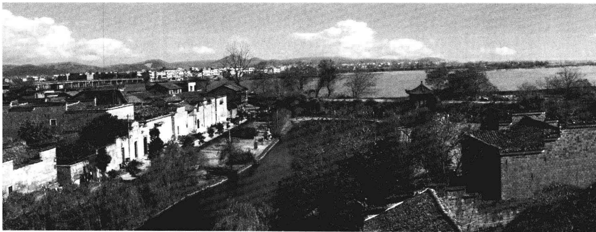
我美丽的家乡——三江