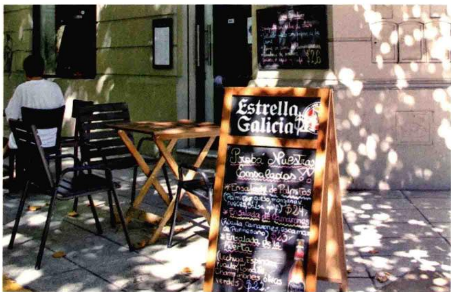
晴天的下午，街角咖啡馆的露天坐椅，静静地等待着客人的到来

至于全球连锁的星巴克，阿根廷也不乏它们的绿色踪迹，一般都依附大商城而设，生意也都不错。星巴克刚进阿根廷之时，曾经引起青年人的热捧，排队买星巴克的纸杯咖啡，成为一时风尚。老人们对此不以为然——这种快餐式的咖啡，居然还要站在那里等待自取，简直丧失喝咖啡的从容和闲适，而且味道也很庸常，没有老咖啡馆那种耐人寻味的香气。可是对于很多年轻人来说，散发着外公味道老式咖啡馆魅力不够，星巴克的无线网络和丝绒大沙发，给了他们时尚生活的遐想和乐趣。