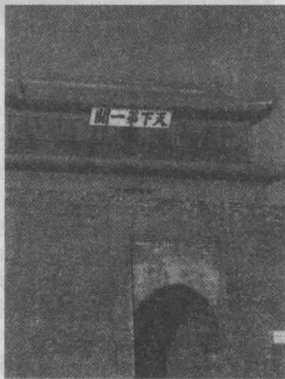
天下第一关——山海关

16世纪初叶，随着欧洲殖民者用新式枪炮对外进行掠夺，西方火器及其制造技术先后传入中国，其中影响较大的有佛朗