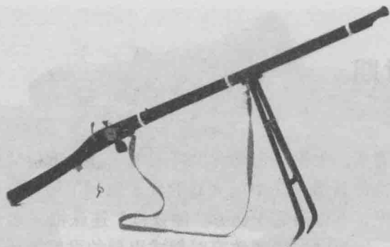
马夏尔尼向乾隆帝进献的自来火枪 现藏于故宫博物院

1757年满清政府自欺欺人地发布禁止外国人在华携带火器的布告，几乎是明白的告诉人家——满清对火器恐惧。这种恐惧一直延续到1842年英国的远征军司令濮鼎查让中国军官在火炮面前惊得目瞪口呆，四千远征军竟击败了满清二万正规军。