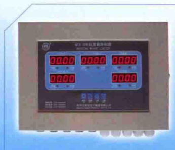
● QCX-3DH型多功能起重重量限制器