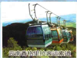
云南香格里拉客运索道