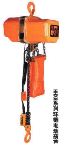
HX系列环链电动葫芦