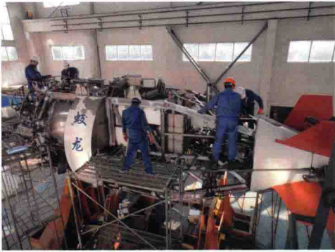
“蛟龙号”载人潜水器无损检测项目