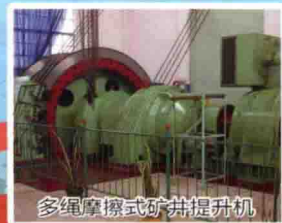
多绳摩擦式矿井提升机