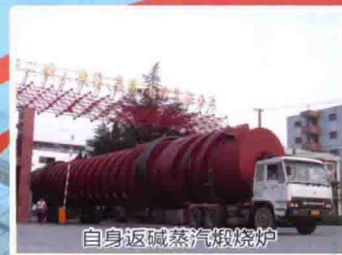
自身返碱蒸汽煅烧炉

地址：四川省江油市建设北路888号 电话：0816-3696888 3696379 E-mail： chuankuang@vip.163.com