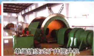
单绳缠绕式矿井提升机