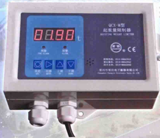
QCX-M型起重重量限制器