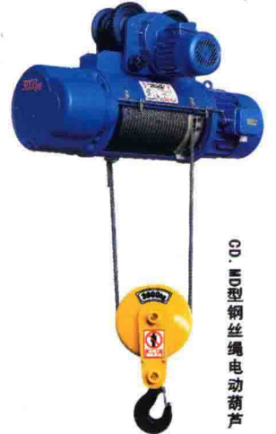
CD、MD型钢丝绳电动葫芦