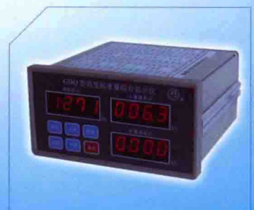
● GDQ型高度起重重量综合仪

地址：江苏省常州市中凉亭夏雷路68号 电话：0519-86643943 86643574 86696883 技术支持：0519-86643940 86653079 E-mail: jishu@51changxin.com