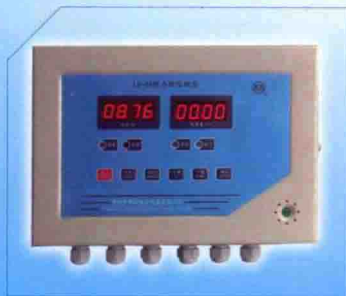
● LX型起重力矩限制器