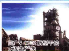
自产5 000t新型干法水泥生产线