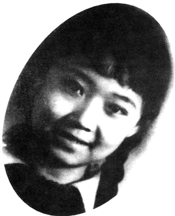
1976年秋，小学毕业留影。