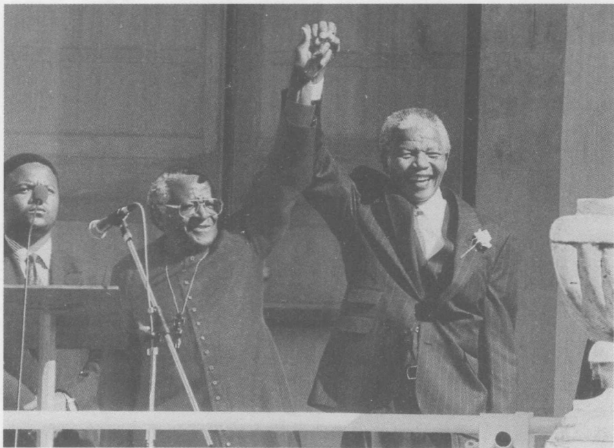
大主教图图是曼德拉的朋友和顾问，他常被人们看作“南非的良知”，而曼德拉则被看作“南非的心”

有一位欧洲国家的首相曾极力要我劝说曼德拉在退休之前去访问他的国家。我知道许多其他国家的领导人也同样认为，如果曼德拉退休之前出访能够成行，将是他们莫大的荣幸。我所认识的国家元首中还没有谁像曼德拉一样应邀出席过这么多的地区峰会，或像他那样去向欧洲、非洲、拉丁美洲和亚洲诸国的国家元首当面做告别访问。