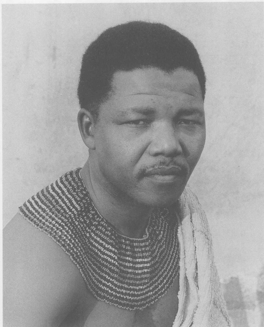
青年时代的曼德拉