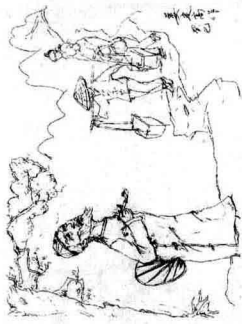
丁巳年 8 丁巳年 8