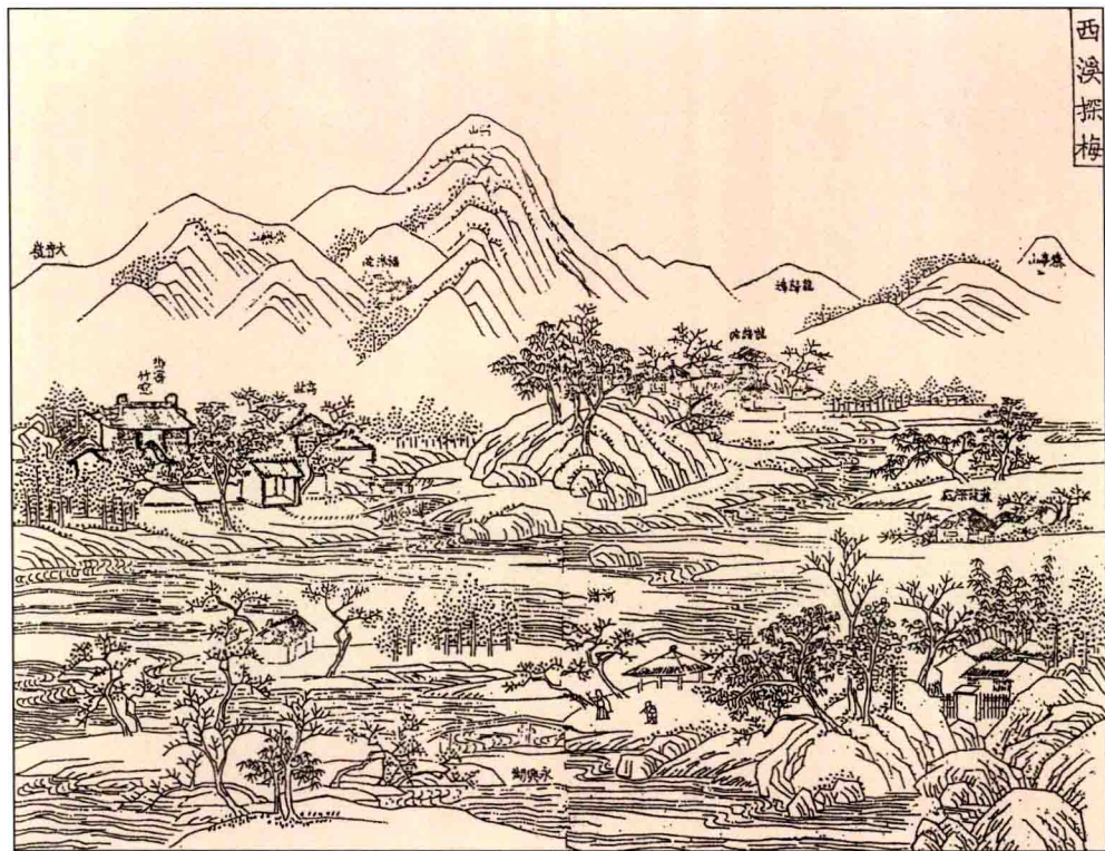
西溪探梅（引自《西湖志》）

西溪之名，始于唐代，以水得名。西溪之水一是源出余杭区闲林镇与富阳市受降镇相毗邻的东天目山板照山麓分金岭、鸭坞岭、长岭一带的灵项溪。灵项溪与金竹、澹竹二岭溪流汇合至上埠河；一是源出临安东天目山北部平顶山南麓的马尖岗，即东苕溪，溪侧向北偏流，最终汇入太湖水系。自筑横塘后，上埠河成了西溪的主流。西溪地区历史上分属于钱塘县、余杭县、钱江县、仁和县和杭县的行政区域内，至明末清初，西溪范围略有缩小。据康熙《钱塘县志》卷三十三《古迹》载：“留溪界方十里，外则西至余杭，南带江而薄富阳；内则北距仁和，东错于湖阴者，起天竺属之桃源岭，实本县之钦贤、调露、定北、定南、上下扇等图也。其山自龙门、黄梅来，而为穆坞，尽于秦亭。其水自分金、澹竹二岭而为镇河。左转古荡，右出闲林，其土百顷。田亦称是，而山泽之数不与焉。”