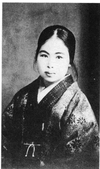
金子美鈴最后一张照片 (1930年3月9日)