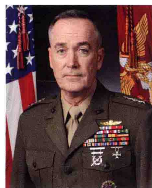
助理指挥官 约翰·帕克斯顿 Gen. John M. Paxton Assistant Commandant of the Marine Corps