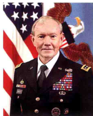
美军参谋长联席会议主席 马丁·登普西 Martin Dempsey Chairman of the Joint Chiefs of Staff