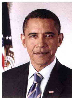
美国总统 奥巴马 Barack Hussein Obama U.S. President