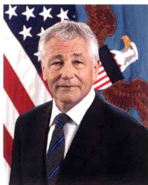
国防部长 查克·哈格尔 Chuck Hagel U.S. Department of Defense