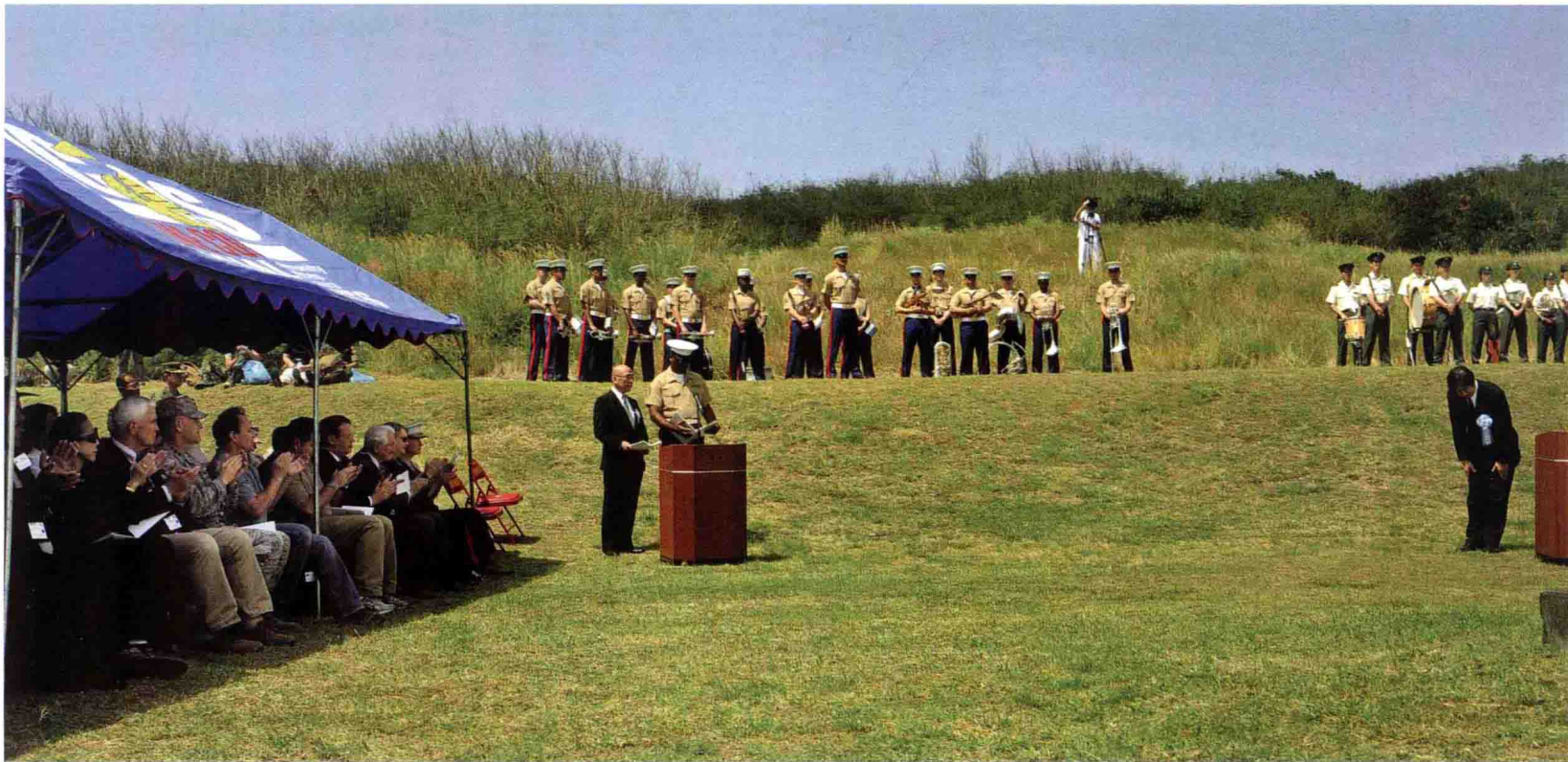
美国海军陆战队第 3 远征军士兵及美国二战老兵参加硫磺岛战役 67 周年的纪念仪式 (2012 年 3 月 14 日)

美国海军陆战队拥有 4 个陆战师: 第 1 海军陆战师位于加利福尼亚州的彭德尔顿; 第 2 海军陆战师位于北卡罗来纳州的勒琼; 第 3 海军陆战师位于日本冲绳的考特尼营; 第 4 海军陆战师为后备单位, 总部在路易斯安那州新奥尔良。