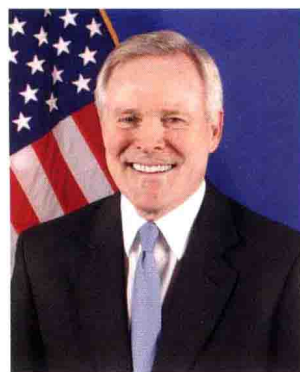
海军部长 雷·马布斯 Ray Mabus Secretary of the U.S. Navy