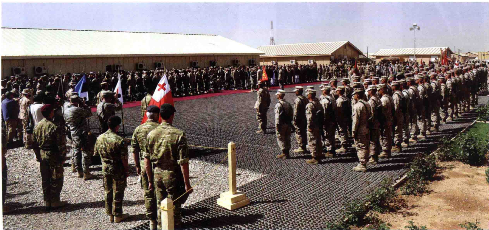
美国海军陆战队第 2 远征军完成在阿富汗的作战任务，举行任务交接仪式（2011 年 3 月 26 日）

空地特遣队的最小规模包含 1 个加强步兵营和 1 个综合航空中队，称为“海军陆战队远征队（MEU）”；最大规模可包含 1 个陆战师、1 个航空联队和后勤补给单位，此时称为“海军陆战队远征军（MEF）”。