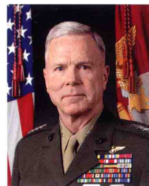
海军陆战队司令 詹姆斯·阿莫斯 General James F. Amos USMC Commandant of the Marine Corps