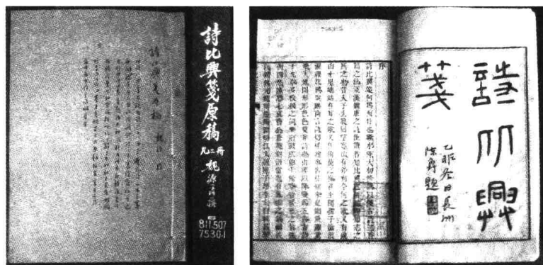
北京大学图书馆 藏《诗比兴笺》原稿