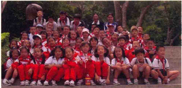
小学二年级同学合影