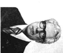
书记处书记杰米契夫