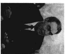
苏共中央总书记勃列日涅夫