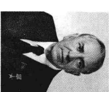
莫斯科市委书记格里申