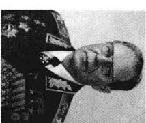
国防部部长乌斯季诺夫