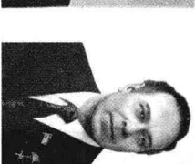
阿塞拜疆第一书记阿利耶夫