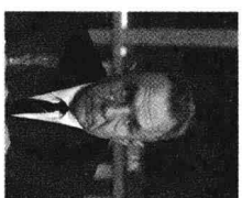
部长会议主席柯西金