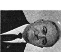
格鲁吉亚第一书记姆扎瓦纳泽