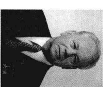
书记处书记基里连科