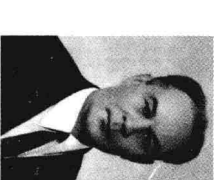
共青团、克格勃领导谢列平