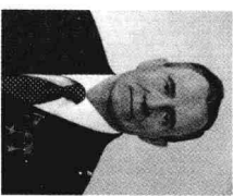
外交部部长葛罗米柯