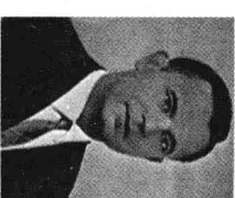
部长会议副主席波利扬斯基