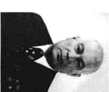
乌兹别克第一书记拉希多夫