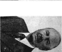
国际部部长波诺马廖夫