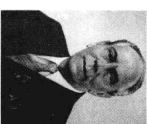
监察部部长佩尔谢