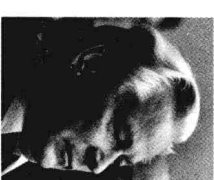
总务部部长契尔年科