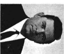
部长会议副主席马祖罗夫