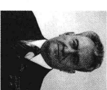
哈萨克第一书记库纳耶夫