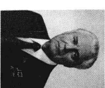
乌克兰第一书记谢尔比茨基