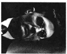
“灰衣主教” 勃列日涅夫