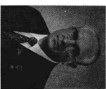
克格勃主席安德罗波夫