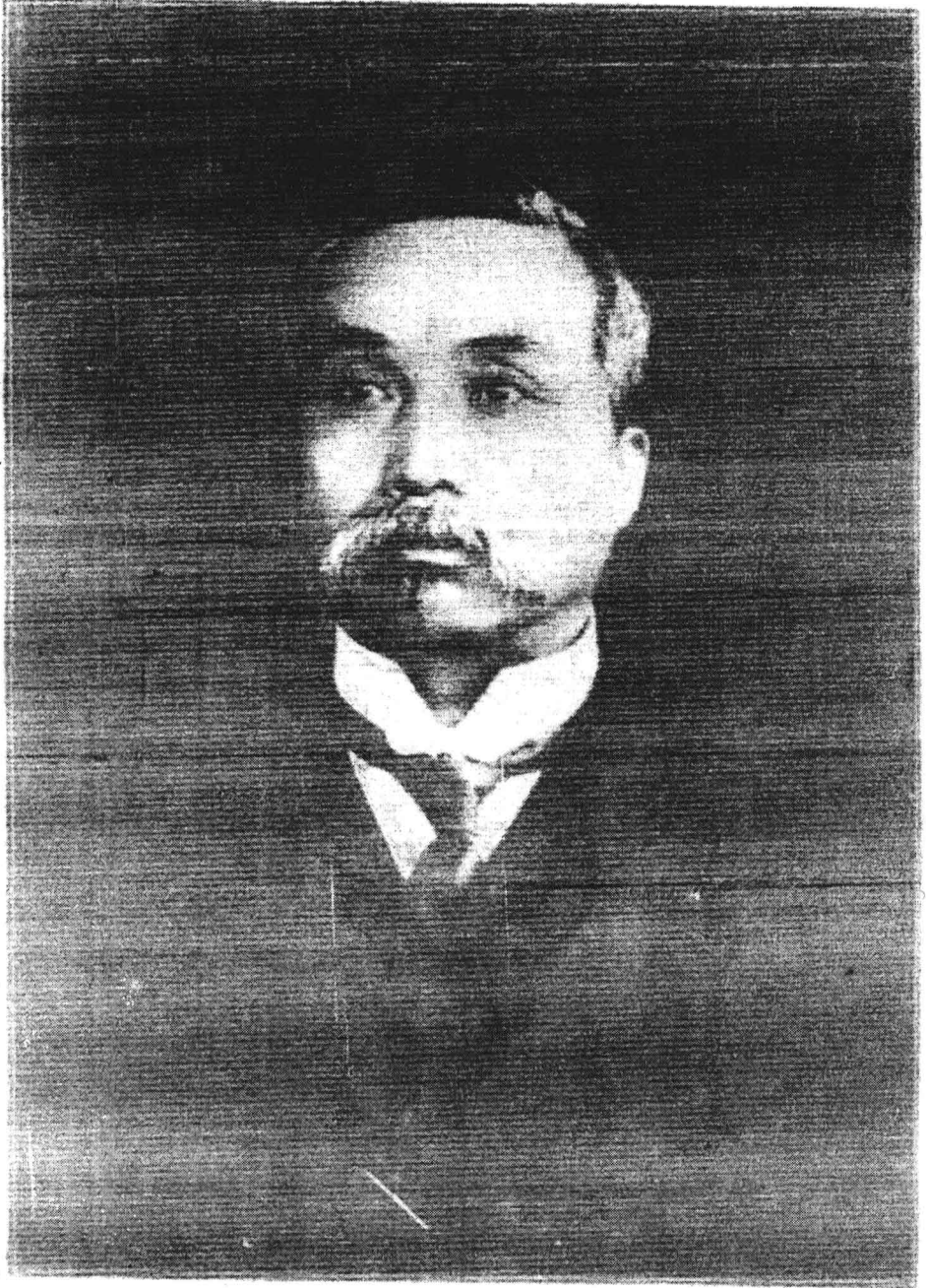
徐 國 務 卿