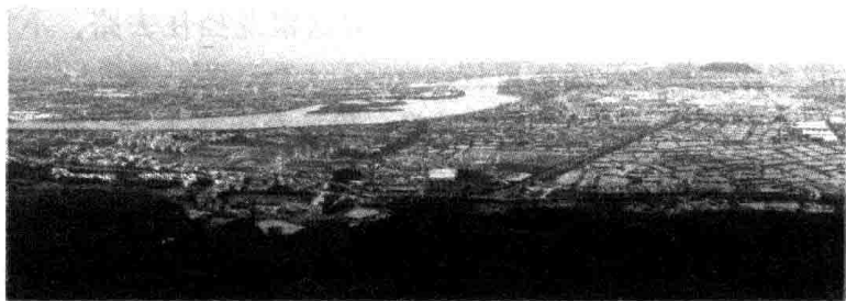
西樵山下的西江和北江

眼看一场灾难平息了，大樵张开两臂，哈哈大笑，一挺胸，倒在地上。大樵的气力用尽了，再也不能站起来了，躯体变成一座山，即今日的西樵山。云姐扑在大樵身上，化为冉冉白云，依恋不离。