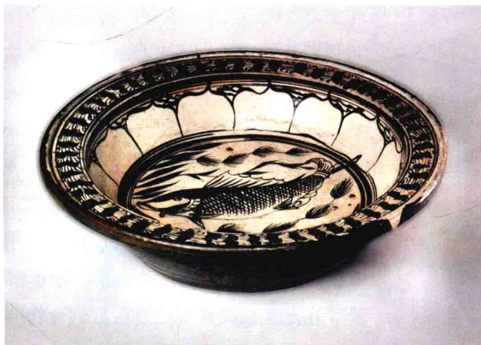
图 9-4 白地黑花鱼藻纹盘 元 高 9 厘米 口径 38 厘米 首都博物馆藏

有的学者认为这是战争所造成的，当时宋室南迁，北方许多优秀的工匠逃亡到南方，同时也把他们的技艺带到了南方。比如景德镇在元以前几乎没有彩绘，是磁州窑的工匠将彩绘方法带了过去。南方一些地方如江西吉州窑，广东的西村窑、海康窑，广西的合浦窑，四川广元窑，福建泉州磁灶等窑址，都曾先后出现过磁州窑类型的器物 [1] ，是不是也受了南迁的磁州窑工匠的影响？（图 9-3、9-4）