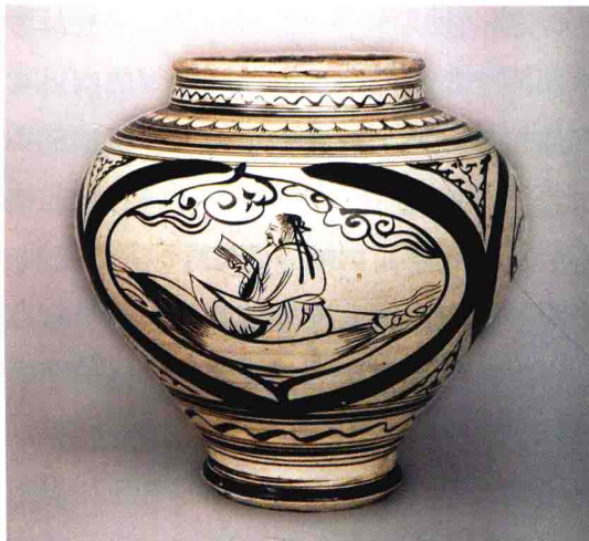
图 9-3 白地黑花人物罐 元 高 30.5 厘米 口径 18.4 厘米 江苏扬州博物馆藏