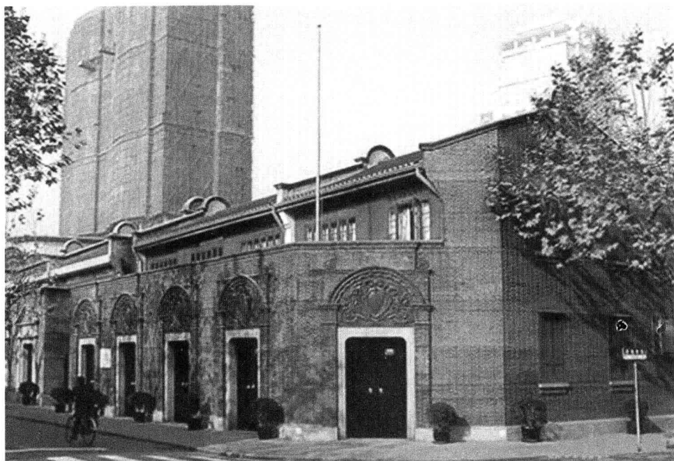
上海中共一大会址