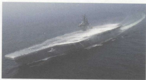
上图：美国“尼米兹”级航空母舰“罗纳德·里根”号。这是“里根”号即将服役前进行舰载清洗系统测试的场面，该系统主要用来清除核生化残留物。

据悉，最初的62艘“阿利·伯克”级驱逐舰的建造工作已经完成。尾舰“迈克·墨菲”号驱逐舰已提早在2012年10月6日的服役仪式前，于5月份被交付给美国海军。此外，关于