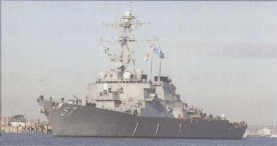
上图：2008年11月12日，美国海军“阿利·伯克”Flight II级“米切尔”号导弹驱逐舰驶离英国朴茨茅斯港。美国海军决定停止建造更多的“朱姆沃尔特”级导弹驱逐舰，转而采购该型导弹驱逐舰。