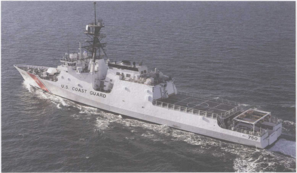
上两图：美国海岸警卫队是美国综合海洋能力的一个重要组成部分，正在推进其现代化计划。这是第一艘国家安全巡防舰“伯瑟夫”号正在试航。