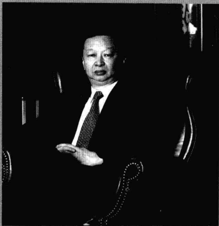
国际围棋联盟主席