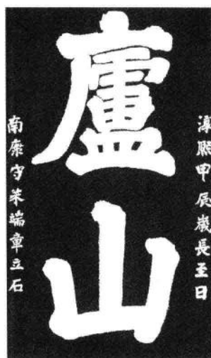
南宋·朱端章“庐山”题刻