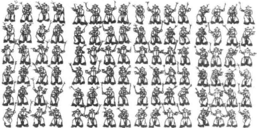
八佾舞的九十六种舞姿

马融《论语训说》：“孰，谁也。佾，列也。天子八佾，诸侯六，卿大夫四，士二。八人为列，八八六十四人。鲁以周公故受王者礼乐，有八佾之舞。季桓子僭于其家庙舞之，故孔子讥之。”朱熹《四书集注》：“季氏，鲁大夫季孙氏也。佾，舞列也，天子八，诸侯六，大夫四，士二。每佾人数，如其佾数。或曰：‘每佾八人。’未详孰是。季氏以大夫而僭用天子之礼乐，孔子言其此事尚忍为之，则何事不可忍为。或曰：‘忍，容忍也。’盖深疾之辞。”范宁《论语范氏注》：“乐舞之数，自上而下，降杀以两而已。故两之间，不可以毫发僭差也。孔子为政，先正礼乐，则季氏之罪不容谈矣。”