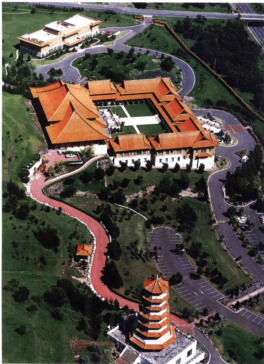
佛光山南天寺鳥瞰圖 澳大利亞新南威爾斯臥龍崗