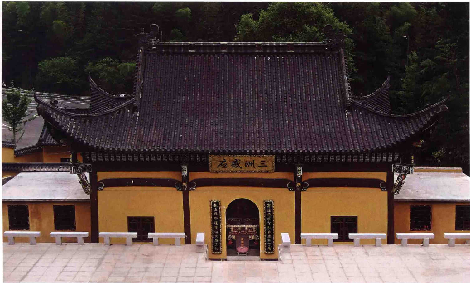
佛光寺天王殿 安徽潛山