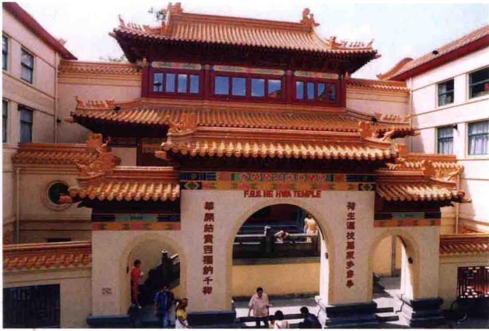
佛光山荷華寺 荷蘭阿姆斯特丹

位於荷蘭阿姆斯特丹市 (Amsterdam)，為臺灣高雄佛光山寺別分院。二〇〇〇年落成，由荷蘭女王碧