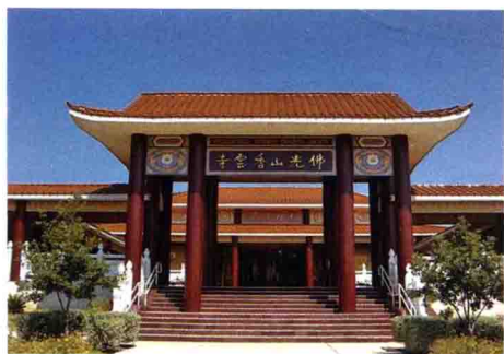
佛光山香雲寺 美國德州奧斯汀