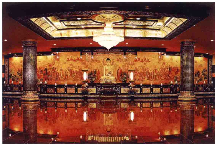
佛光山蘭陽別院大雄寶殿內部 臺灣宜蘭

該寺主體建築高十七層，地下三層，地上十四層，內設滴水書坊、念佛會、蘭陽文教中心、佛光大學城區部、社區大學教室、佛光緣美術館、社教館、禪堂、大雄寶殿、大會堂等。大雄寶殿內供奉釋迦牟尼佛坐像，佛像後方壁面為畫家宓雄所繪的華嚴世界圖。殿內有四根柱子，上鑄《阿彌陀經》、《觀世音菩薩普門品》、《金剛般若波羅蜜經》、《藥師琉璃光如來本願功德經》，柱頂和柱礎以錘鏢打造；兩側壁面鑄《地藏菩薩本願經》。殿內彌陀燈仿陝西扶風法門寺地宮的唐朝（618~907）遺物所製，為該殿之特色。