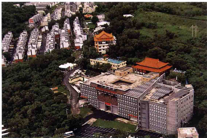
佛光山福山寺鳥瞰圖 臺灣彰化