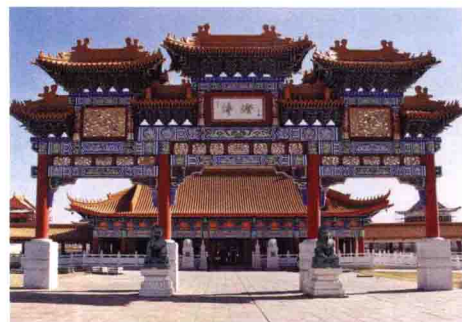
佛光山南華寺山門

一九九四年創辦非洲佛學院，接引非洲各國學子來此參學。該寺長期舉辦禪修與念佛活動，並於當地以慈善事業為橋梁，每年參與救濟、捐贈輪椅及認養孤兒等，致力推動佛教本土化不遺餘力。