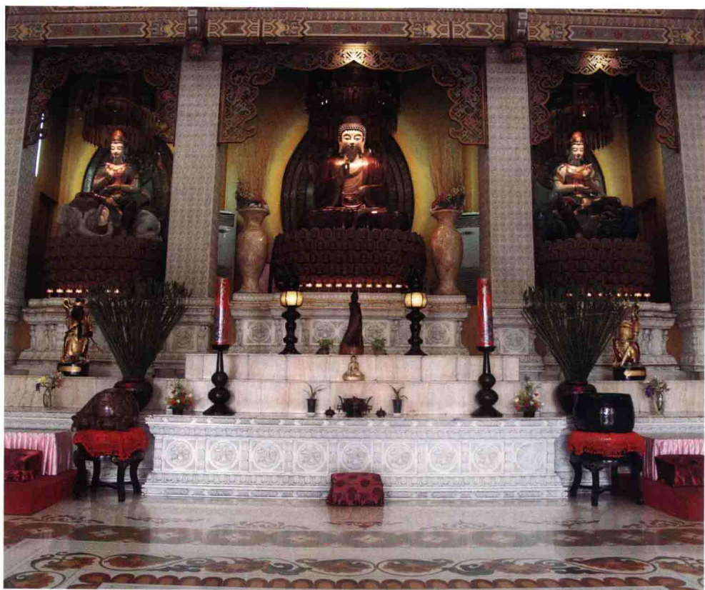
佛光山圓福寺華藏寶殿華嚴三聖像

偈題曰：「救苦尋聲祇為圓通因耳得／分身度世但憑感應莫形求」。淨土殿於一九九三年增建，高五