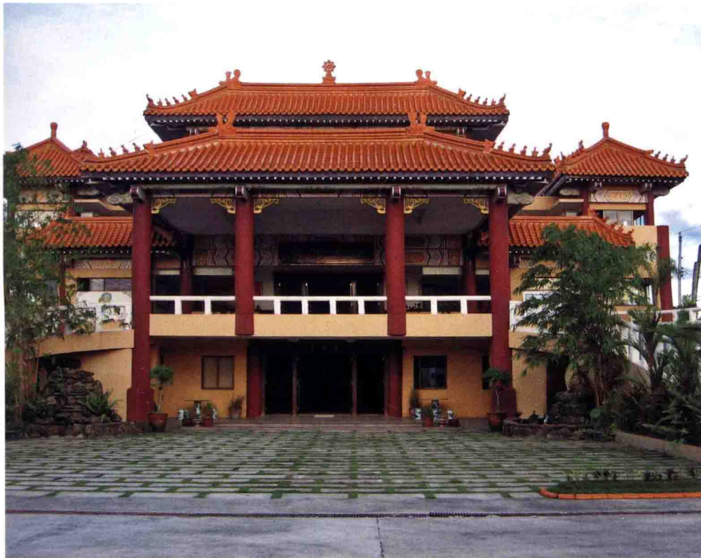
佛光山圓通寺 菲律賓西黑省描戈律

位於菲律賓西黑省描戈律市 (Bacolod, Western Visayas)，為臺灣高雄佛光山寺的別分院。一九八七年，描戈律法藏寺董事會禮請臺灣高雄佛光山寺法師前往弘法。一九九〇年，蔡淑慧、陳素珍代表信徒向佛光山寺開山宗長星雲大師表明獻地之意。臺灣佛光山寺遂於此地建寺，開始當地的弘法工作。