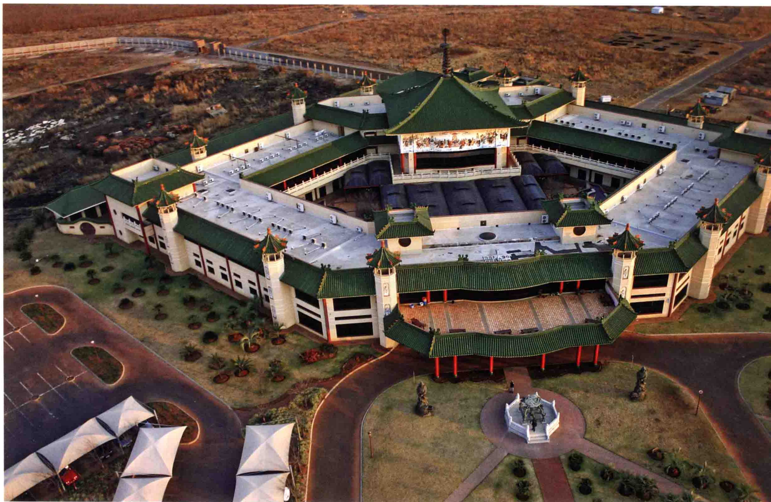
佛光山南華寺信徒會館