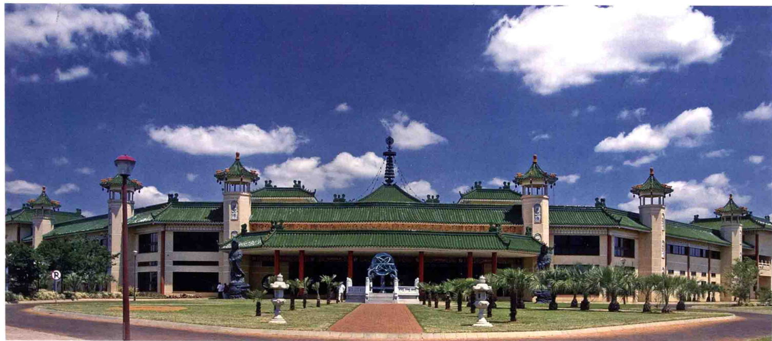
佛光山南華寺信徒會館