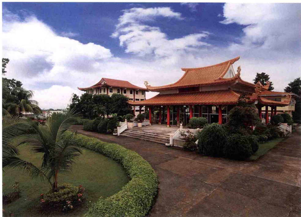
佛光山慈恩寺 菲律賓宿霧

該寺占地面積約1.8公頃，主要建築有觀音殿及地藏殿。觀音殿為重檐歇山頂，額題「佛光山慈恩寺」，周設迴廊，柱題「慈心似日月願法界眾生少苦惱／恩德如山海望宇宙人間多和平」，為佛光山寺開山宗長星雲大師所書。殿內供奉觀音菩薩，菩薩像前兩側柱上題「慈悲普被大眾決定萬修萬人去／恩信同施十方合當一念一如來」。地藏殿為歇山頂，高三層，第一層