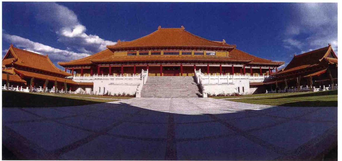
佛光山南天寺大雄寶殿

位於澳大利亞新南威爾斯州臥龍崗市 (Wollongong, New South Wales)，為臺灣高雄佛光山寺的別分院，是南半球第一大佛教寺院，亦為該國東方文化的象徵。一九八九年澳洲政府為嘉惠旅澳華人及促進東西方宗教文化交流，由臥龍崗市長歐凱爾 (Francis Neville Arkell) 捐地10公頃，作為建寺用地。一九九一年由佛光山寺開山宗長星雲大師與臥龍崗市政府簽約，翌年動土興建，一九九五年舉行落成啟用暨佛像開光典禮。一九九九年榮獲當地觀光大獎及最佳庭院設計、燈光、建築師等獎項。二〇〇四年舉辦國際三壇大戒。