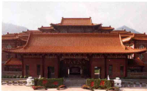
佛光山金光明寺山門

該寺於一九九九年獲該國文化、藝術及旅遊部宣布為宗教景點，二〇〇三年榮獲雪蘭莪州發展局旅遊部頒發「州級景觀競賽優秀獎」，二〇〇四年起並擴大舉辦春節平安燈會，為一所結合傳統叢林和現代化的寺院。