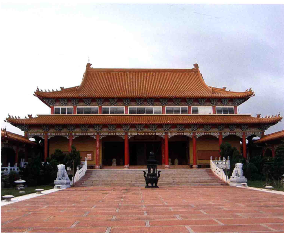
佛光山海天佛剎大雄寶殿 臺灣澎湖