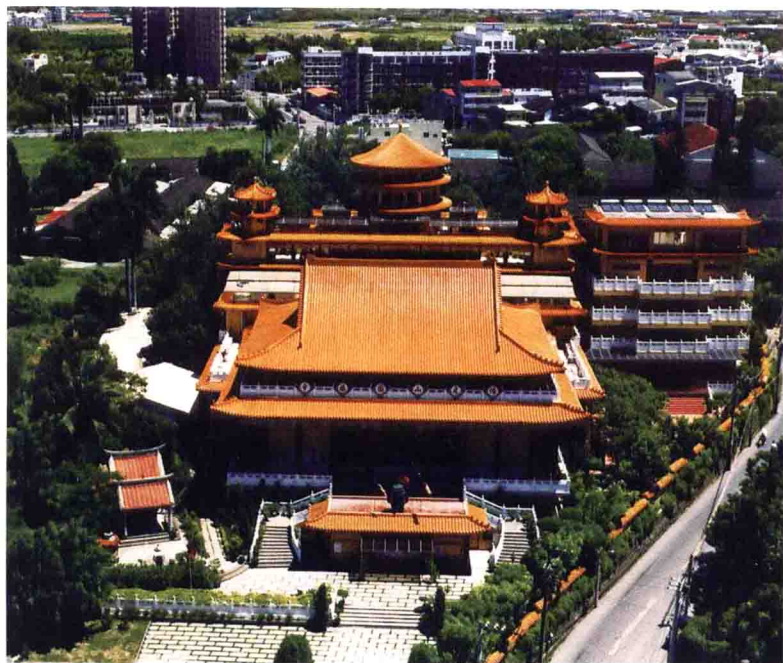
佛光山圓福寺鳥瞰圖 臺灣嘉義