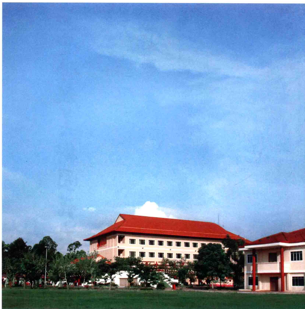
佛光山東禪寺 馬來西亞雪蘭莪瓜拉冷岳

又稱馬來西亞佛光山。位於馬來西亞雪蘭莪州瓜拉冷岳縣仁嘉隆新村（Jenjarom, Kuala Langkat, Selangor），為臺灣高雄佛光山寺的別分院。原是洪益成村長夫人郭建鳳女士發心捐贈之南華寺，一九八六年佛光山開山宗長星雲大師於該國弘法，郭女士捐獻近1公頃土地，作為建寺之用。一九八九年星雲大師主持動土儀式，一九九六年完成，並成立東禪佛教學院。