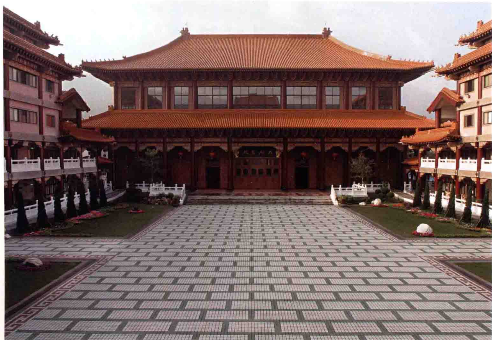
佛光山金光明寺大雄寶殿 臺灣新北

該寺於一九九九年獲該國文化、藝術及旅遊部宣布為宗教景點，二〇〇三年榮獲雪蘭莪州發展局旅遊部頒發「州級景觀競賽優秀獎」，二〇〇四年起並擴大舉辦春節平安燈會，為一所結合傳統叢林和現代化的寺院。