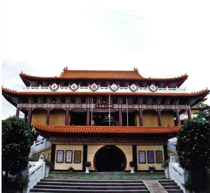
佛光山圓福寺華藏寶殿

位於臺灣嘉義市東區，為高雄佛光山寺之別分院。始建於清道光十三年（1833），寺內碑銘猶存。日治昭和十二年（1937）毀於中日戰爭，一九四五年後重建。一九四八年政府選定為嘉義八景六勝之一。一九五七年開正法師接任住持。一九八〇年延請佛光山寺接管，翌年重建，更名為佛光山圓福寺。