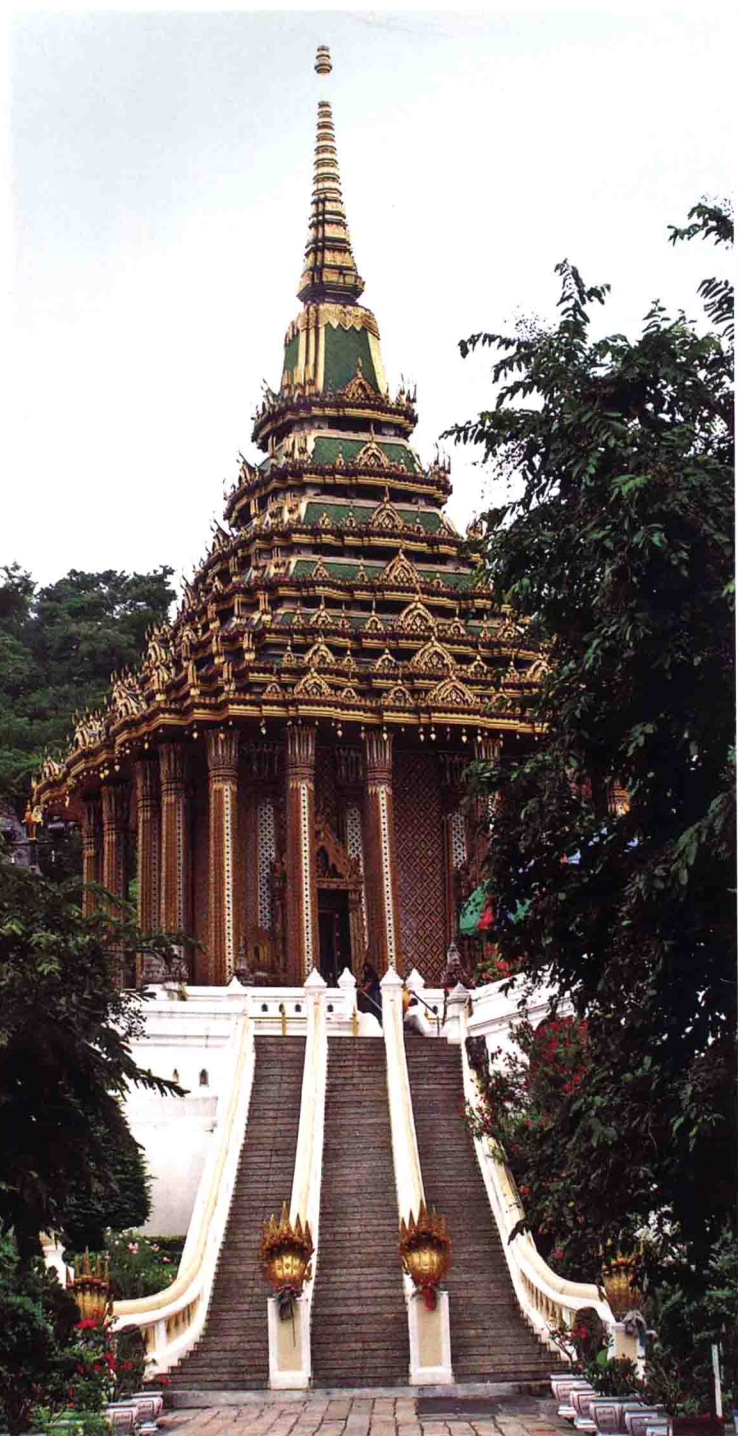
佛足寺佛足殿 泰國北標