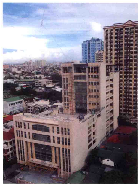
佛光山萬年寺 菲律賓馬尼拉

原名馬尼拉禪淨中心。位於菲律賓大馬尼拉馬尼拉市 (Manila)，係臺灣高雄佛光山寺在菲國首都的第一座別分院與弘法中心。