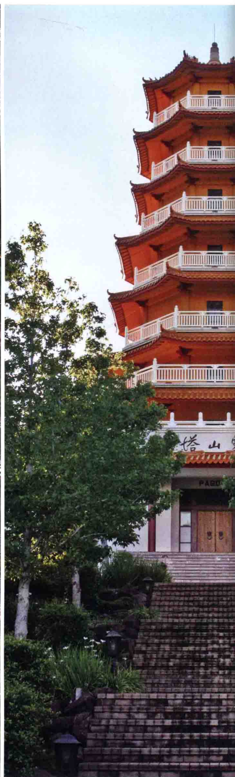
佛光山南天寺靈山塔