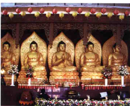
佛光山海天佛剎大雄寶殿五方佛坐像

位於臺灣澎湖縣馬公市東衛後山，是澎湖地區最具規模的佛寺，為高雄佛光山寺的別分院。一九七六年星雲大師至澎湖弘法，有鑑於澎湖未來佛教的發展，於一九八三年創建。因地處馬公、湖西、白沙、西嶼之交通要衝，東接山脈，西臨海灣，登高遠眺，海天一色，故名海天佛剎。澎湖為臺灣最大的離島，廟宇林立居臺灣之