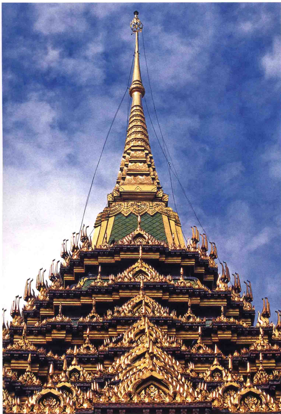
佛足寺佛足殿殿頂