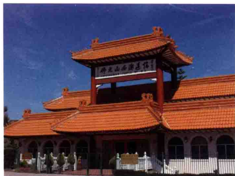
佛光山西澳道場 澳大利亞西澳柏斯