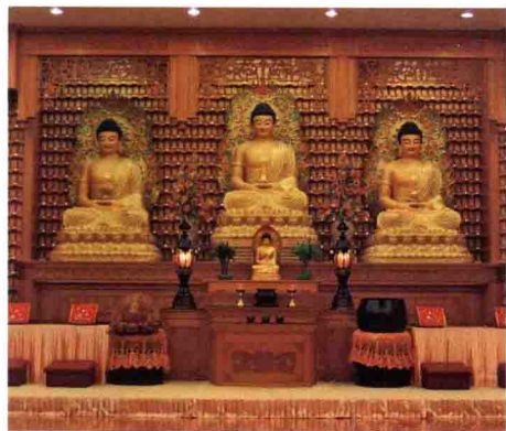
佛光山西澳道場大雄寶殿三寶佛坐像

位於澳大利亞西澳柏斯市（Perth, Western Australia）。一九九三年正式成立國際佛光會西澳協會，次年於現址建西澳道場，一九九七年落成，為臺灣高雄佛光山寺西澳的首座別分院，是當地東西文化的橋梁。