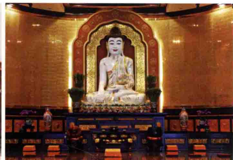
佛光山金光明寺大雄寶殿玉佛坐像