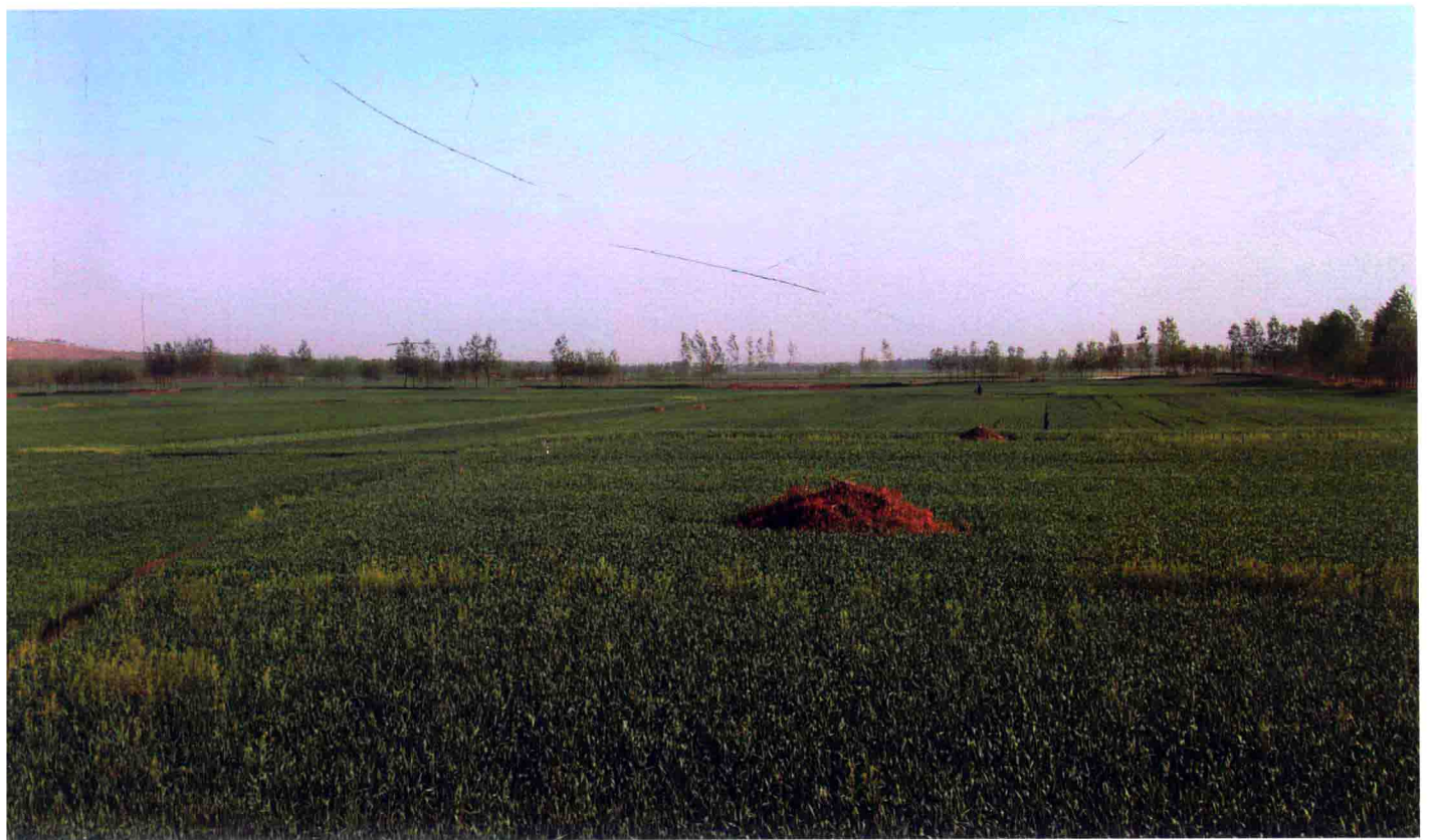
2. 梁王城遗址远景（西北—东南）