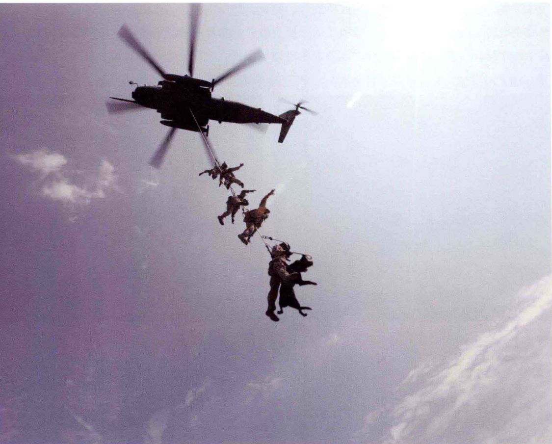
特战队员进行敌后垂直空降

序、侦察、游击战、作战效果评估与核查等。第四，模拟训练，普遍采用先进的训练模拟器材和场地或室内使用的对抗模拟器材，如坦克、直升机模拟驾驶仪以及美军的多用途激光交战模拟器和计算机交战模拟设备等。