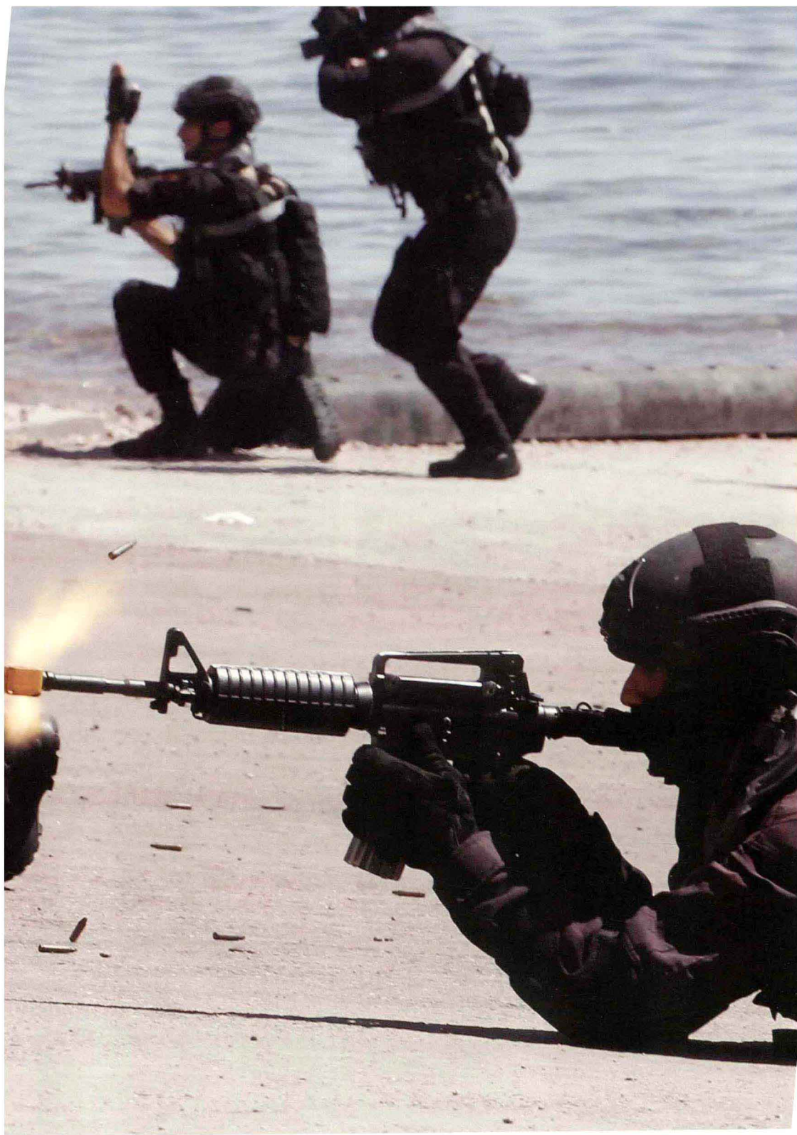
特战队员在海边进行战术训练