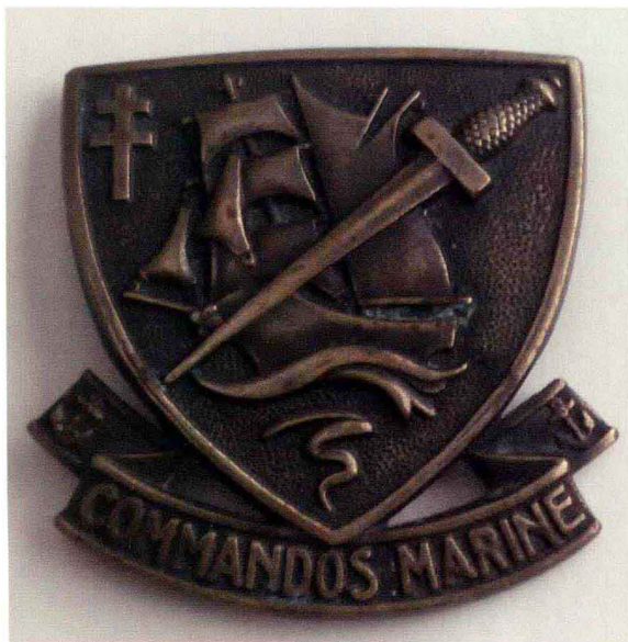
二战期间英军特种部队的徽章

在二战的欧洲战场上，英军从1940年开始就受到德军猛烈的攻击，然而“绅士”般的英军怎能抵挡“虎豹”一样的德军。1940年6月4日，溃不成军的英军实施了战略大撤退——敦刻尔克大撤退，当日，英军卸甲解衣从法国敦刻尔克撤回了英国本土。看到受重创的英军，英国首相丘吉尔痛心不已，为了能够鼓舞英军士气重返战场，丘吉尔制订了“反攻大陆”计划。但此时英军仅剩下一些“身受重伤”的部队，依靠这些部队来反攻大陆谈何容易。