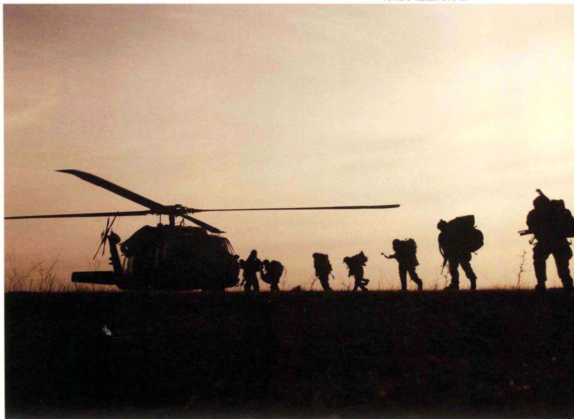
特种小分队搭乘直升机