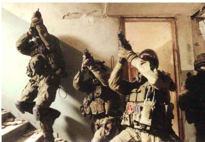
特战小组室内行动

美国正在研制可载12人的小型潜艇。此外，特种部队的装备还包括各种特种专用装备和高级电子设备，如滑雪、登山和潜水装具，地（水）面定位导航设备、卫星通信设备、夜视与红外侦察设备、遥控侦察飞机等。