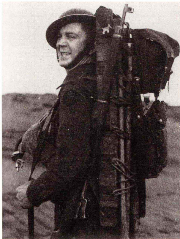
“哥曼德”全套戎装训练照