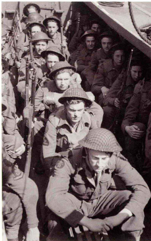
英军特战队员乘船准备登陆作战