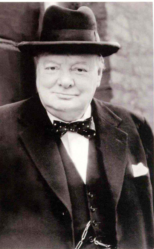
丘吉尔是特种部队发展历史上的一个关键性人物