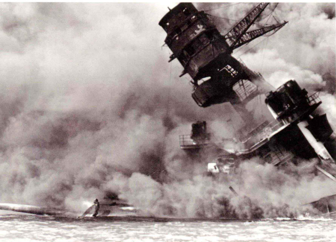
珍珠港受到攻击的照片