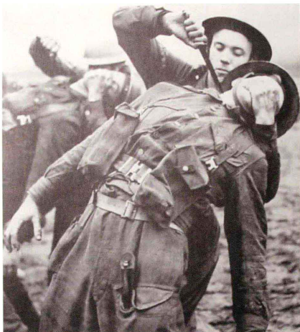
英国特种部队训练照