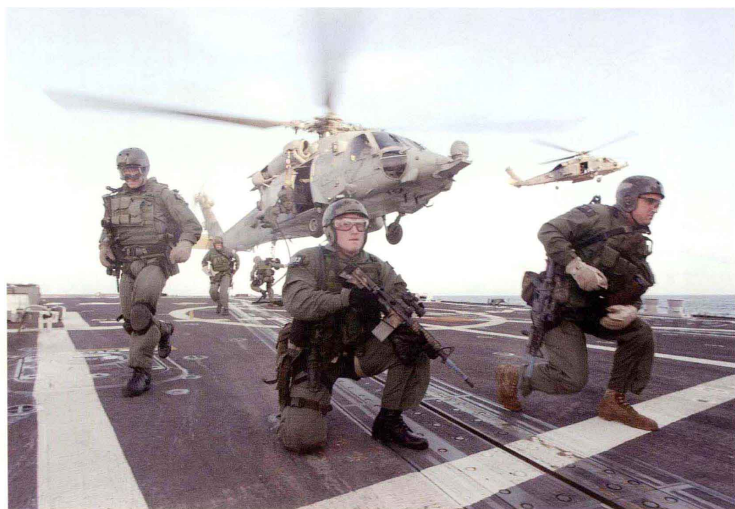
特战队员以精干的战术小组为主