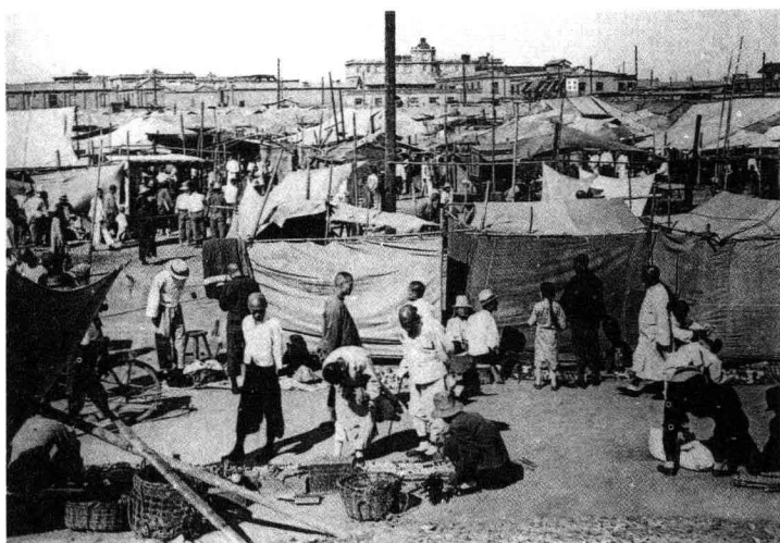
北京的天桥、南京的夫子庙、天津的三不管，是著名的“杂巴地”，是江湖艺人聚焦之地。图为 20 世纪初的三不管

小说，名为《高买》，写的就是老天津的一个贼界名流，或者说是高级贼头，类如后来的著名人士。高买的活动范围都在大商号，瑞蚨祥、谦祥益。再比如中国大戏院，得知老王爷明天到中国大戏院看戏，待一切布置停当，第二天老王爷到戏院的时候，从他身边一过，一点儿感觉没有，怀里那只荷兰怀表不见了。老王爷大怒，这块表是老佛爷的赏赐，丢了这块表，被老佛爷知道，那是要问罪的。