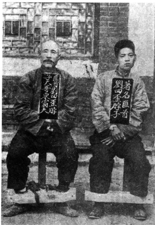
天津著名匪首刘四歪脖子及其大哥东霸天