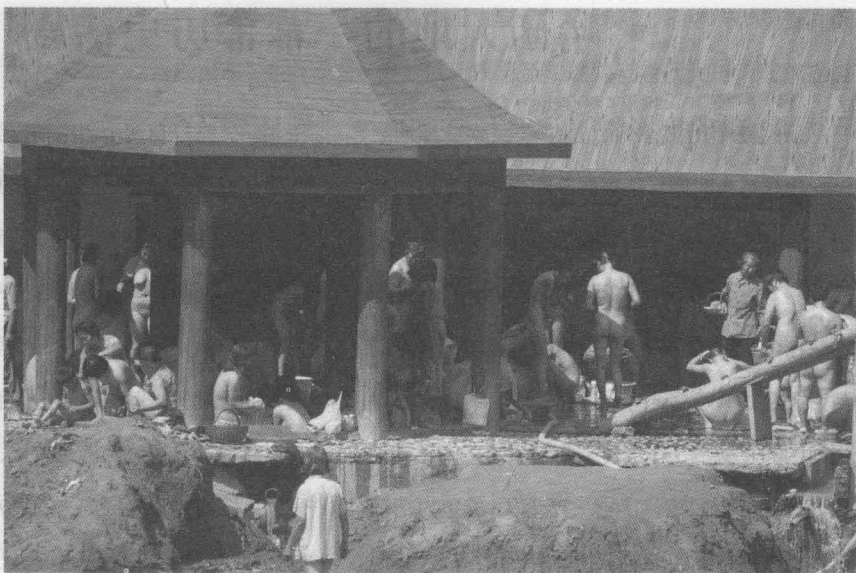
卢氏汤池操浴习俗

峡谷之中，被誉为中华民族不屈不挠精神的象征。函谷关是中国古代著名的雄关要塞之一，紫气东来、鸡鸣狗盗、公孙白马等成语典故和许多改变中国历史进程的战争均发生于此。老子西出函谷时，在这里写下千古名著《道德经》，太初圣官由此成为道家之源。函谷关也因名人、名关、名著而饮誉海内外。位于市区北部的虢国遗址博物馆是目前我国规模最大、出土文物最多、保存最完整的西周大型邦国墓葬群，1996年被国务院公布为国家级重点文物保护单位。虢国遗址2001年被国家文物局评定为20世纪中国100项重大考古发现之一。此外，中国古代四大回音建筑之一的宝轮寺塔、秦赵会盟台、义马鸿庆寺石窟、杜甫《石壕吏》遗址、黄河古栈道、空相寺、安国寺、甘棠苑（钟鼓楼）等名胜古迹处处昭示着三门峡悠久灿烂的古代文明。