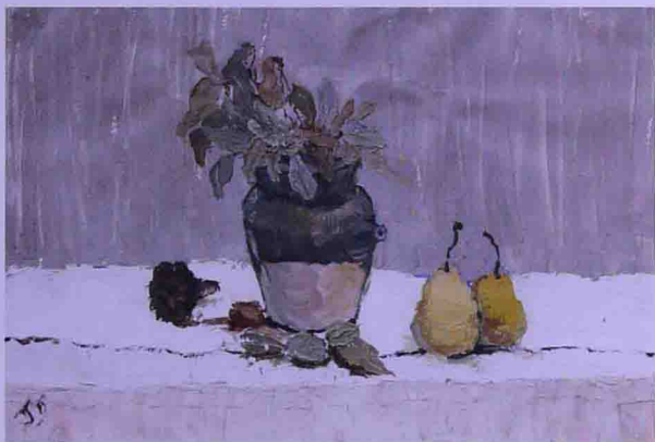
陶罐静物 作者 康恒建

只要我们所用的各种色彩之纯度较低，即大多数或全部色彩都是灰色、深沉之色，那么画面色彩的组合就一定是调和的。因为低纯度的颜色在视觉上没有多少冲击力。它们之间也互相随和其他的各种色彩，不产生抗争。所有的低纯度色彩在冷暖性上都靠向中性色。由这些含蓄、缓和的色彩构成的画面柔和、静谧、优雅而稳定。