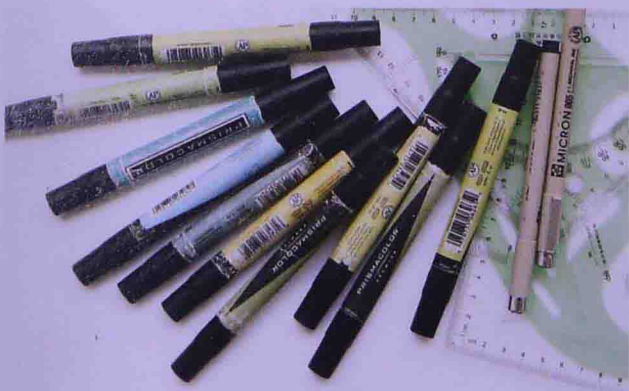
美国三福油性马克笔