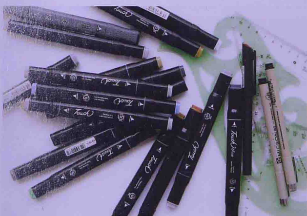
韩国Touch的油性马克笔

美国 AD 高端马克笔，颜色效果很好，颜色近似于水彩的效果，价钱贵，但气味比较刺鼻。