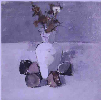
陶罐静物 作者 康恒建