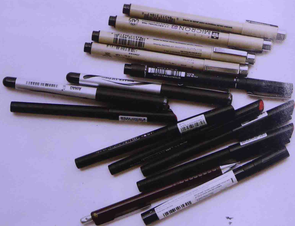
针管笔、会议笔、中性笔

在市面上常见到的以圆珠型笔尖和免再吸墨水笔芯为主要的中性笔，因其便捷、洁净和书写流利等特点，广泛使用，品牌众多，有爱好、日本三菱、晨光等。