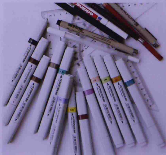
日本美辉马克笔、尊爵马克笔

日本美辉水性马克笔，是比较常见的水性马克笔，用起来手感比较好，但笔尖比较窄小表现大面积图形不是很方便。尊爵水性马克笔效果也还好，色彩有些灰。这两种水性马克笔都溶于水，要是与水结合使用有水彩的效果。要注意水性马克笔的色彩不能多遍地叠加，否则会对纸张有伤害，影响画面效果。