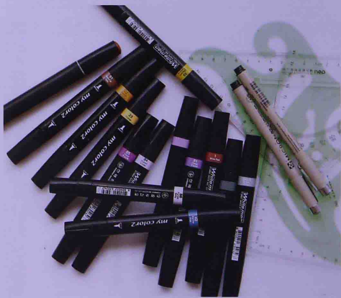
韩国my color2 油性马克笔