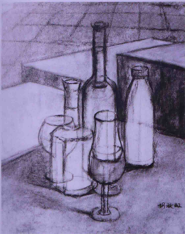
结构素描景物 作者 胡秋红

素描中的结构素描又称设计素描，能更好地帮助设计者理解形体、结构、空间、表现形体，对初学者来说十分重要。素描是设计专业的基础，可以通过写生、静物、人物、风景和临摹优秀的素描作品提高素描基本功。