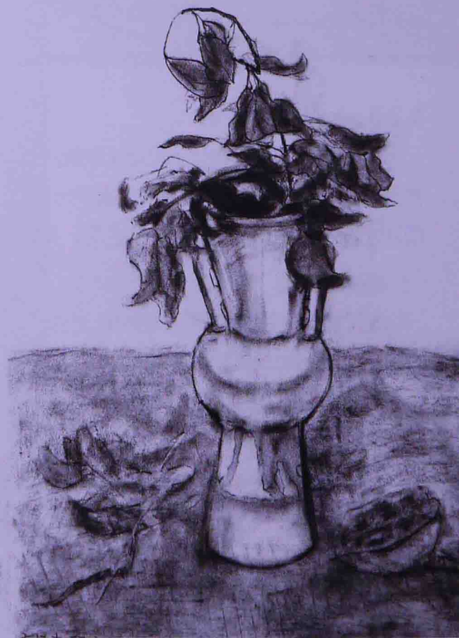
花瓶 作者 康恒建