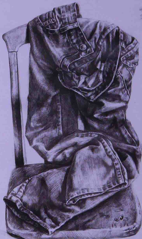
素描牛仔裤 作者 张蕊

学习素描的过程是学会概括主次、取舍、强调等观察方法和表达方式的过程，也是对形体的空间和二维平面上的表现加深认识的过程。一幅马克笔设计手绘表现图中的素描关系的处理、黑白灰面积比的好坏，将直接影响到画面的整体效果。