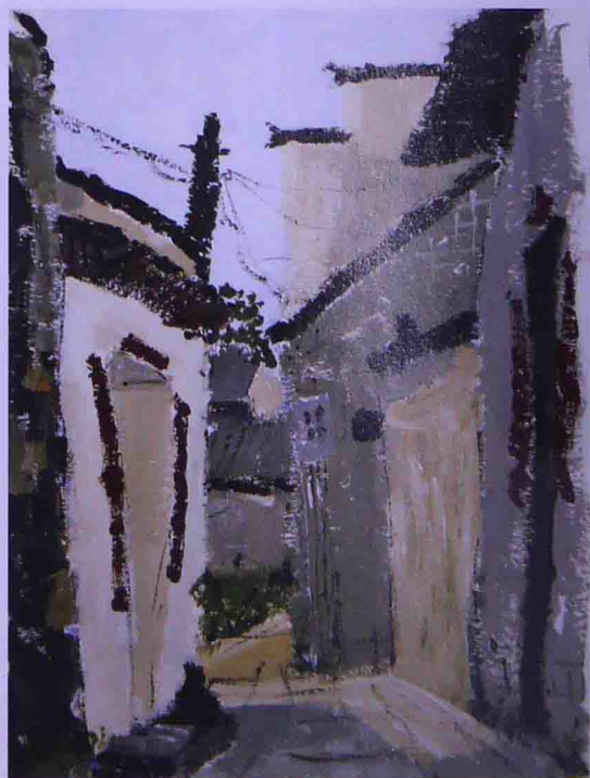
宏村写生 作者 阮洋

画面色彩调和感的产生是靠画面共同色彩因素的积累，画面中这种共有的色彩因素越多画面就越调和，或者说画面中同种色彩因素所占的总面积越大，画面就越协调，柔和。如在大自然的风景写生中画面中大部分是绿色植物，导致画面的主导色彩基调为绿色。占画面大面积的绿色调有很强的调和感。