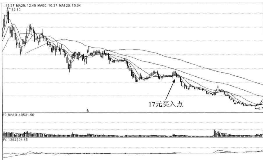
图 1-2 云海金属日线图

有一位朋友，看好了云海金属（002182）这只股票，2008年1月份40元一股重仓买进，后来看大市不好，卖了，卖了是对的。到8月份奥运会召开之前，他看举国迎奥运，重大利好啊，云海金属已经从42元跌到17元，又要买，我说不行，你再看一看，他没有听，又重仓杀进。结果怎么样啊？云海金属只涨了几天，又返身向下继续下跌，一直跌到11月份，最低跌到5.7元，赔个鼻青脸肿。如图1-2。