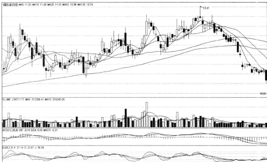
图 1-4 股价走势图

大家知道，目前在各种股票软件中，移动平均线是应用最广泛的一个指标。K线和移动平均线构成股价走势图的主体，而K线是挂在均线上的；下面是成交量；再下面才是其它技术指标。盘面的排列顺序是：价，量，其它指标。为什么要讲这个？因为明白这一点很重要，你应该清楚，移动平均线是一个本体性的指标，而其它的技术指标都是在价和量的基础上派生出来的，是间接的、第二位的指标，是“抽象画”。如图1-4。