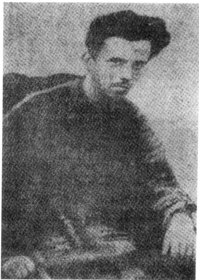
N.A. 奥斯特洛夫斯基 (1904—1936)