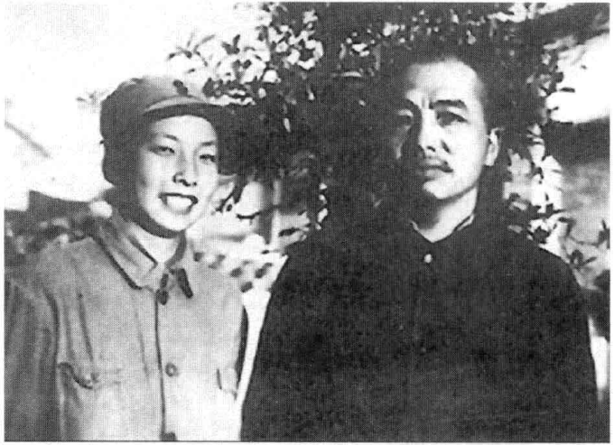
彭德怀和 浦安修在八 路军总部的 合影