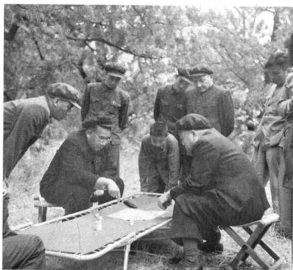
1952年，彭德怀从朝鲜回北京汇报工作期间，和朱德在十三陵游览时下棋（右立者为邓小平）