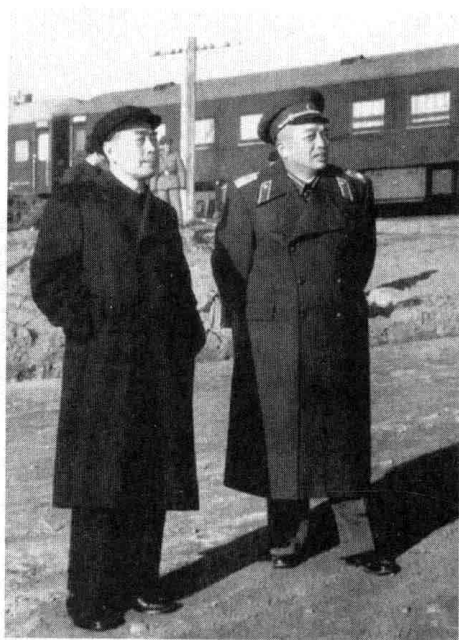
周恩来和中国人民志愿军第一任司令员兼政治委员彭德怀在一起