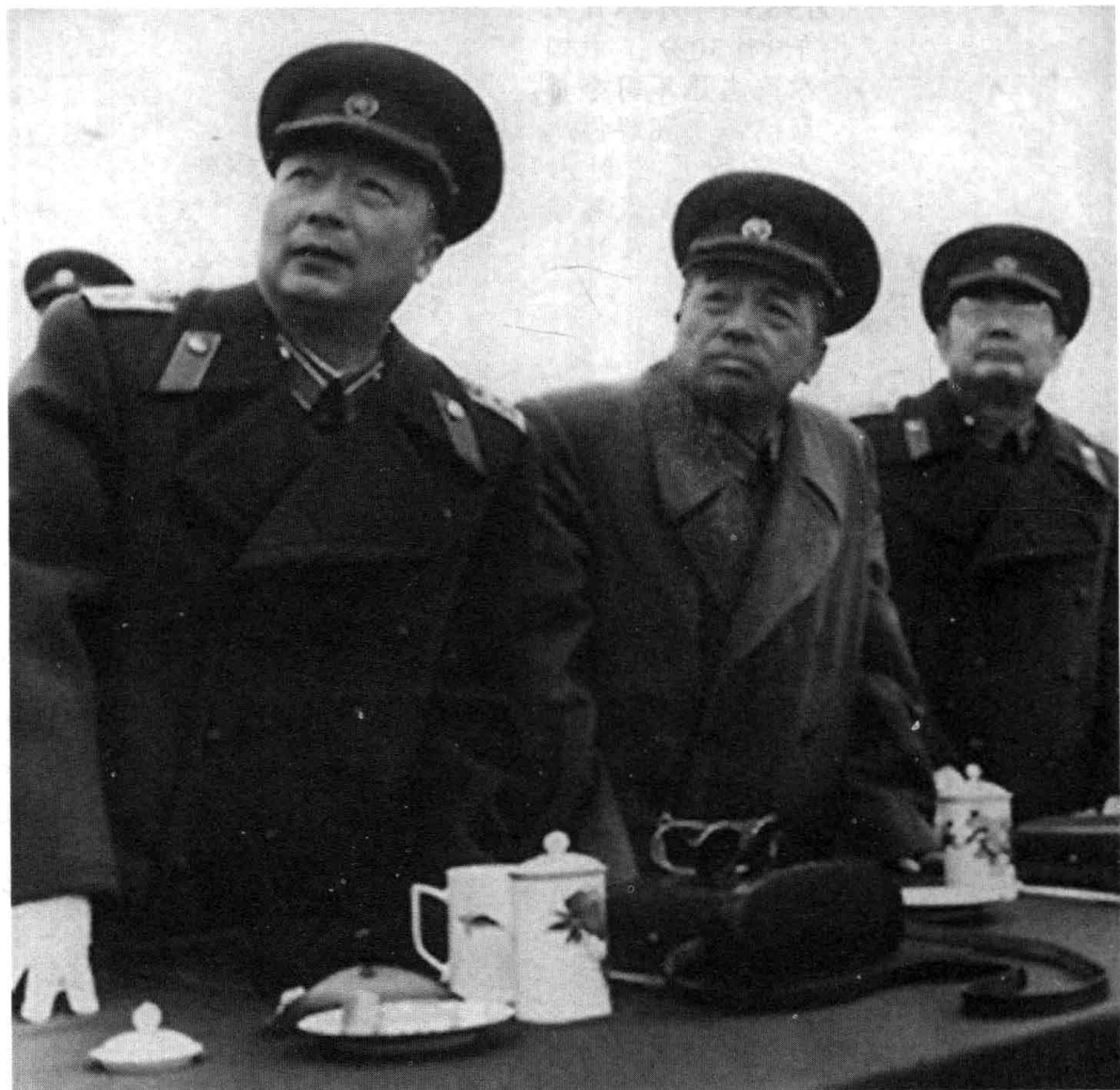
1956年，彭德怀元帅观看空军飞行表演，左起：聂荣臻、彭德怀、叶剑英