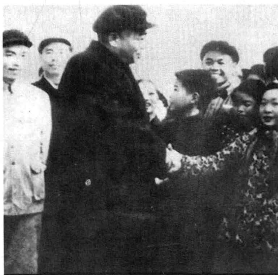
彭德怀1958年在湖南湘潭调查