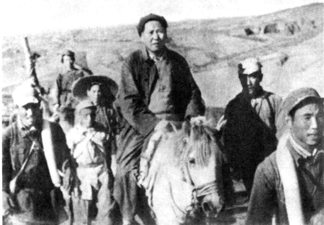
毛泽东坚持不离开陕北，正是基于对彭大将军的信任