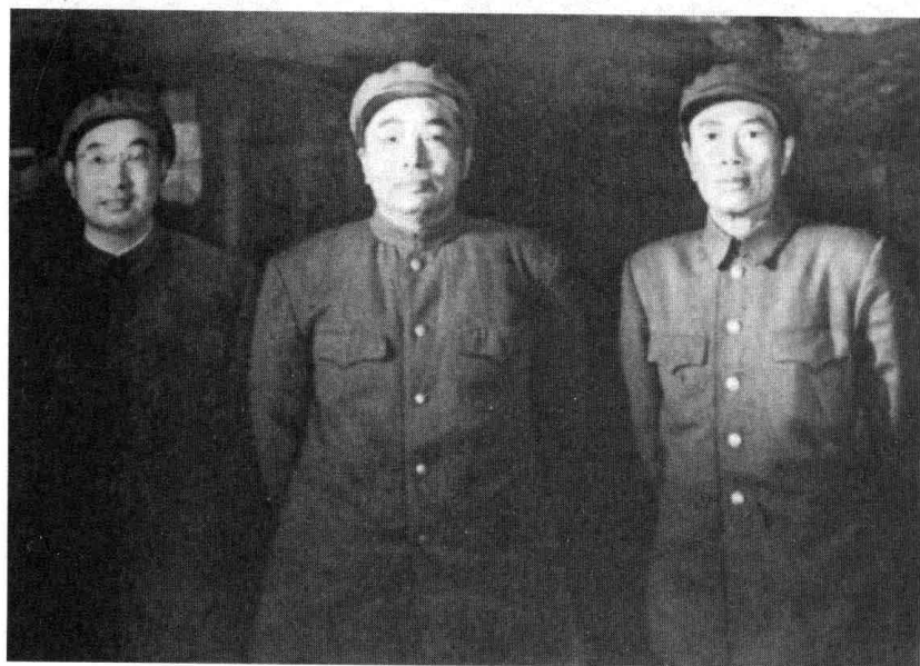
志愿军总司令彭德怀和陈赓（左）、邓华（右）副司令合影