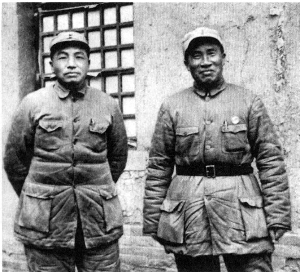
1939年，朱德总司令和彭德怀副总司令合影