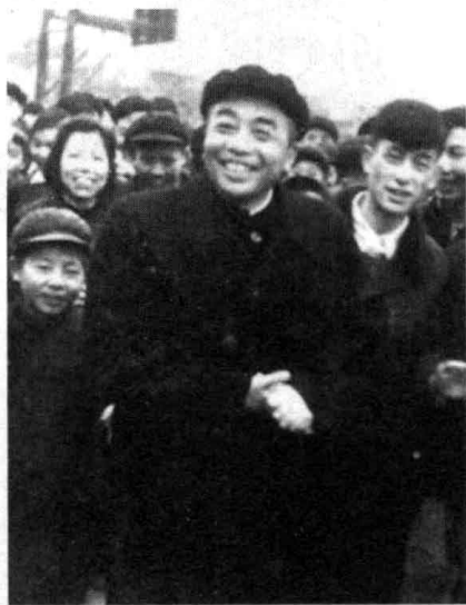
1958年，彭德怀到湖南平江县视察，与人民群众在一起

（由于时间关系，与本书使用的部分照片的摄制者尚未联系上，请有关摄制者及时与出版社联系，以便敬付稿酬。）