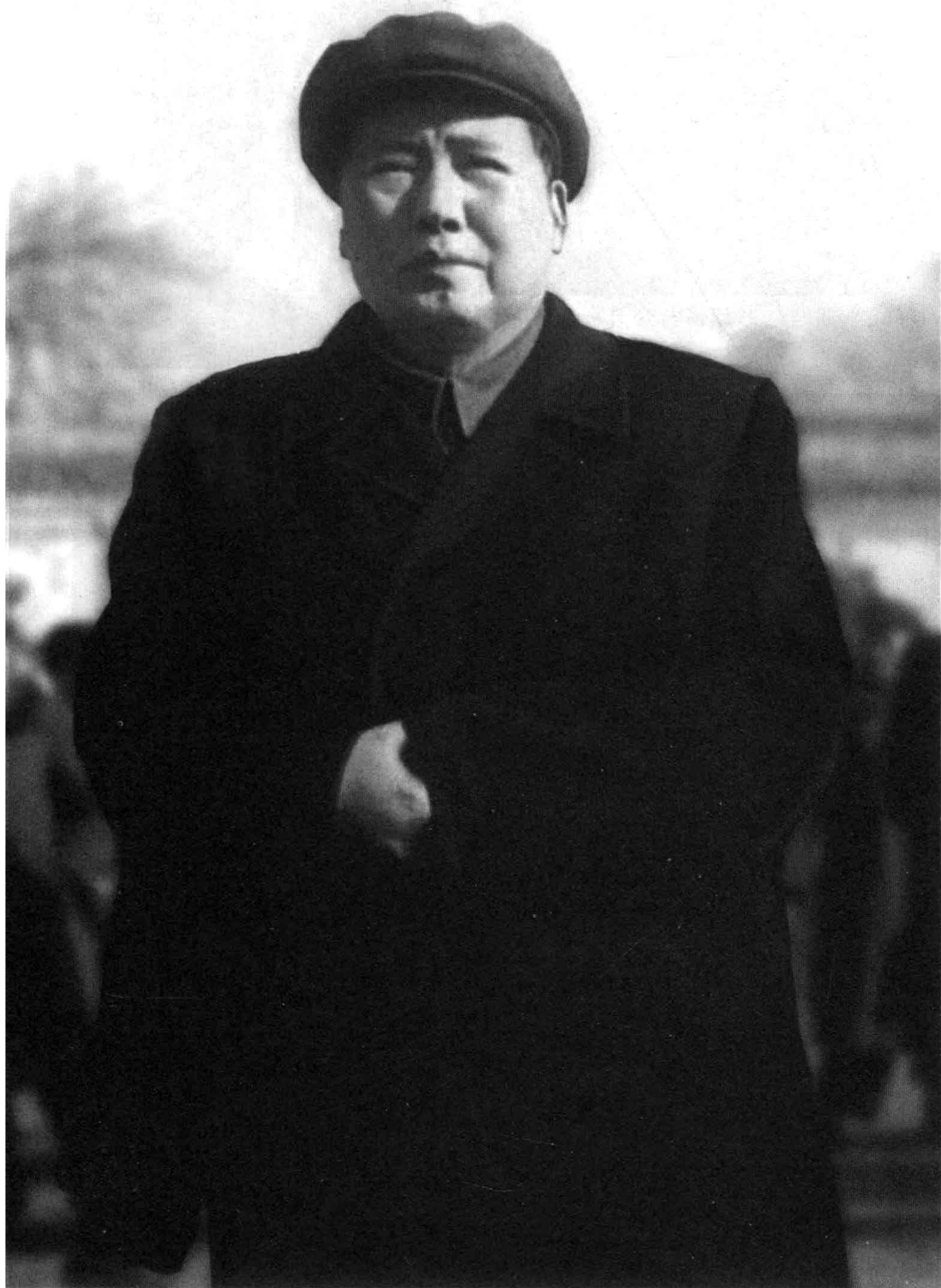
毛泽东与彭德怀在中南海