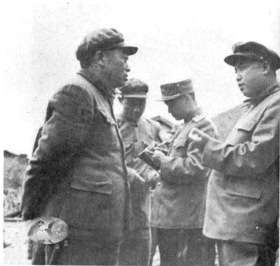
朝鲜战争期间，彭德怀与金日成交流战事