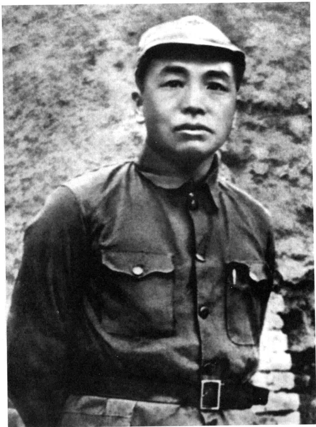
红军到达陕北后彭德怀留影