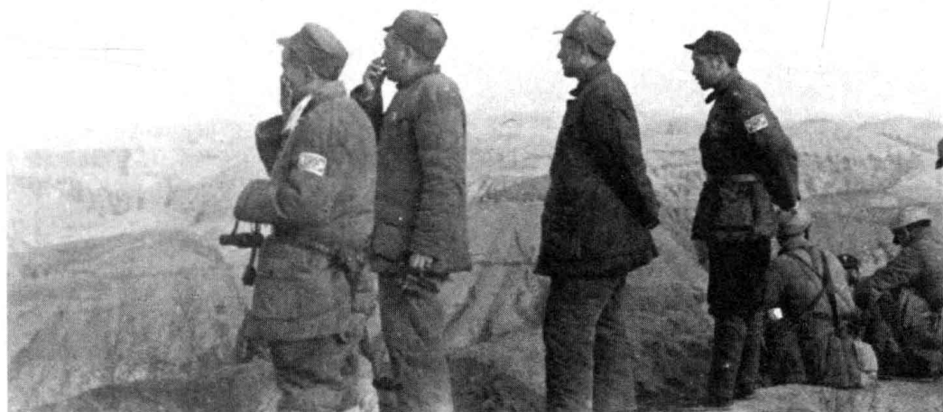
彭德怀（左二）、习仲勋（左三）等在青化砭战役的前沿阵地上