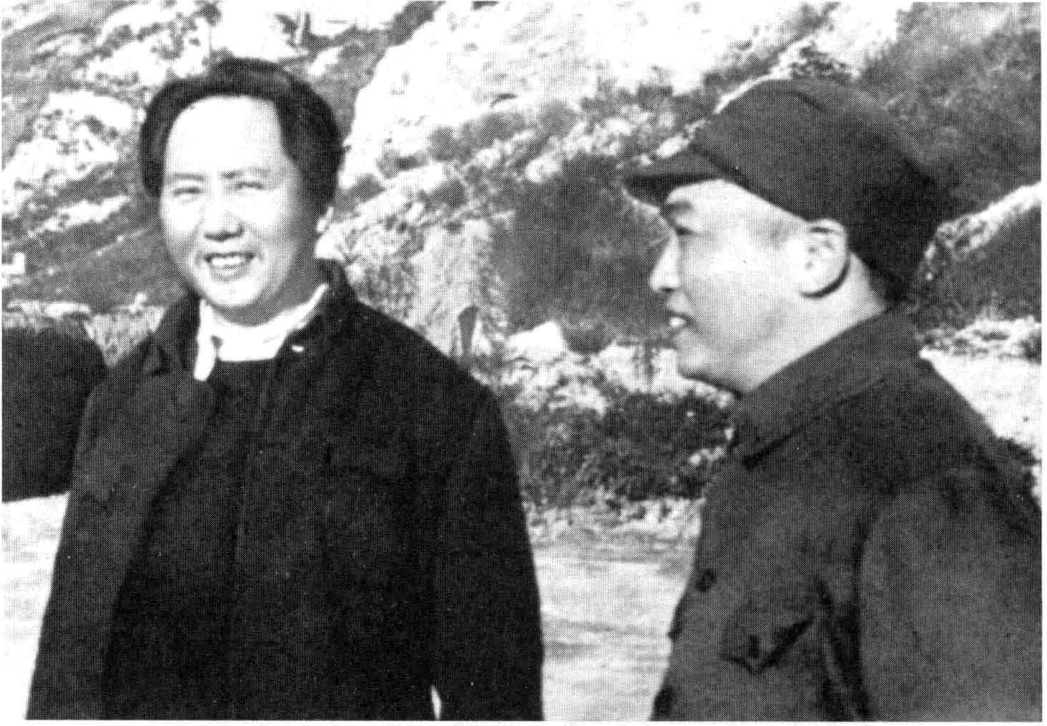
1944年，毛泽东和彭德怀在延安合影