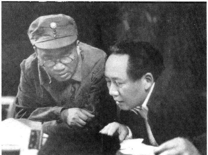
毛泽东和 朱德在七 大主席台 上