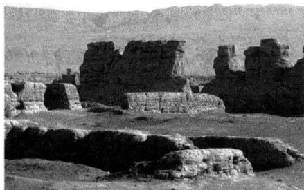
图 1-5 高昌古城