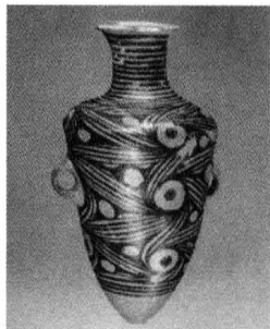
图 1-2 仰韶文化马家窑型尖底瓶