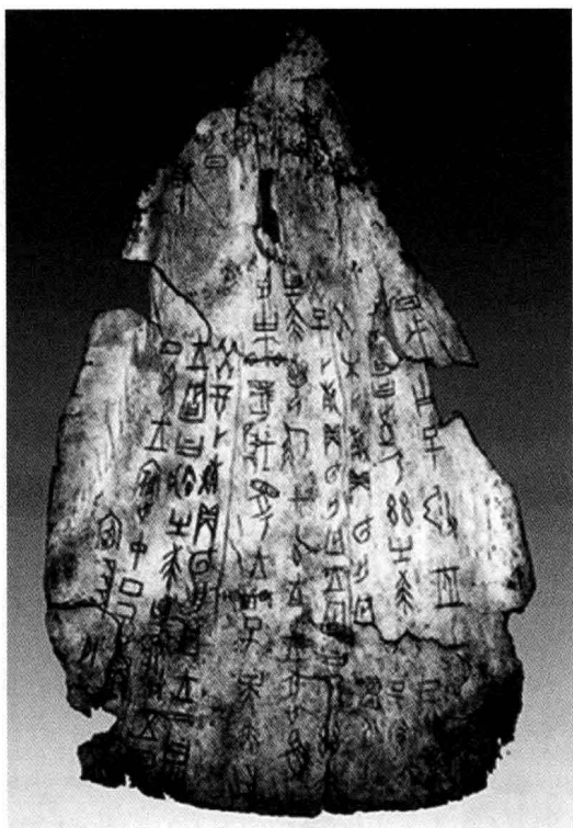
图 1-4 殷商甲骨文化

白垩纪恐龙的化石吗？其实郎中所谓的“龙骨”，无非是深埋地下数千年的大型动物的肩胛骨之类而已。一次偶然的机会，他发现准备加工服用的“龙骨”上竟然还布满了类似于图 1-4 所示那样的、数千年前先人所契刻的、由线条构成的各种“纹样”。经这位当时的文字学家也是退休官员的研究，终于弄明白了这些竟然是当时还全然不曾了解到的、契刻在牛肩胛骨或龟甲之类表面的殷商时代的文字。自此引发了在其家乡河南安阳小屯村发掘殷商甲骨的热潮，这些被发掘出来的，契刻有如图 1-4 所示纹样的龟甲、骨片就被称为殷商甲骨文化。也就是说，殷商先民们在他们那个时期所创造的文字（Characters）及其载体也被称为一种文化。其实先秦的钟鼎石刻，以及后世的隶、楷、行、草等文字及其木简、竹简、绢帛、纸张等载体也无不被称为一种文化。