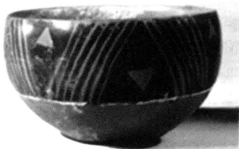
图 1-1 仰韶文化半坡型陶钵

在考古活动中最常用的词汇就是“文化”了。常说、也常听到这是一种什么文化，那又是一种什么文化。如最早在河南渑池仰韶村发掘出了种种施彩的坛坛罐罐，称为仰韶文化或彩陶文化，也因其烧制的陶坯呈赤色而称为赤陶文化。而这些都是约 4500 年前仰韶先民们所创造的陶制实用器物。类似的实用器物还发现于西安东郊的半坡村（图 1-1），它是约 6500 年前的先民们所制作的器物。还有如图 1-2 所示，出土于甘肃马家窑的彩陶。这些相似的陶器不论发掘于何处、不论制作的年代、不论是否在其表面施有彩色纹样，它们都属于人类社会生产技术发展到同一水平的，相互间具有内在密切联系的新石器时代后期的产物，并且它们所支持的也都是一种类似的生活方式，所以就将它们归类为同一文化类型。由于这些陶制器物由最初出土地河南渑池的仰韶村命名，故归类统称为仰韶文化。