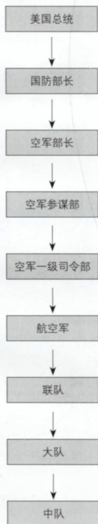
美国空军的行政指挥系统