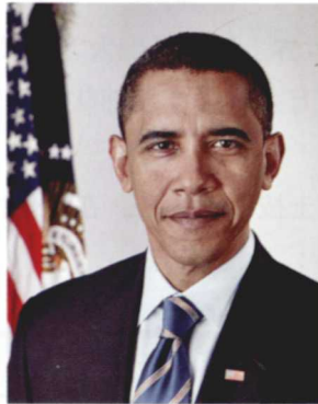
美国总统 奥巴马 Barack Hussein Obama U.S. President