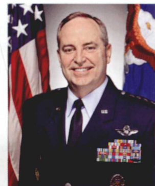
空军参谋长 马克·威尔什 Mark A. Welsh Chief of Staff