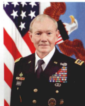
美军参谋长联席会议主席 马丁·登普西 Martin Dempsey Chairman of the Joint Chiefs of Staff