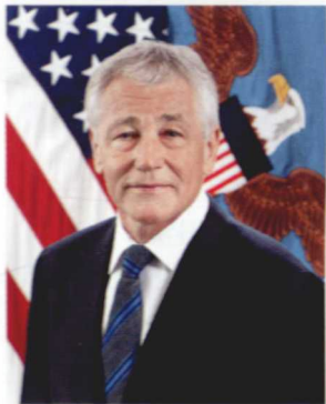
国防部长 查克·哈格尔 Chuck Hagel U.S. Department of Defense