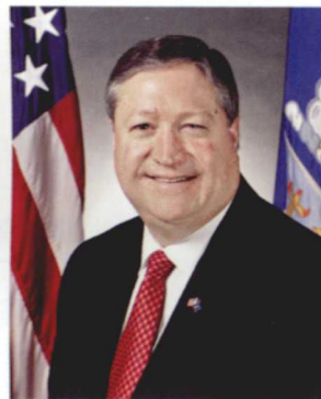
空军部长 迈克尔·唐利 Michael B. Donley Secretary of the Air Force