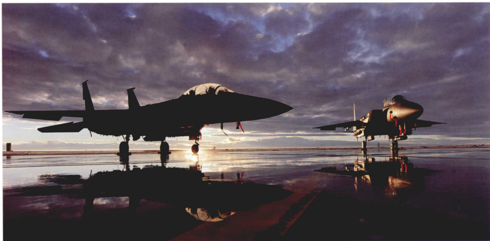
爱达荷州霍姆山（Mountain Home）空军基地，第391和第389战斗机中队的两架F-15E“攻击鹰”战斗机（2010年12月6日）

航空军的下一级单位是联队（wing），配备有飞机的联队称为飞行联队（flight wing），大多数飞行联队都有自己的基地（AFB）。这些联队同时也是基地的行政管理单位。一些专业联队没有配备飞机但同样拥有作战使命，如空间联队、信息战联队等。另外，还有部分联队没有作战使命，是纯粹的行政管理单位，称为空军基地联队（AFB wing）。