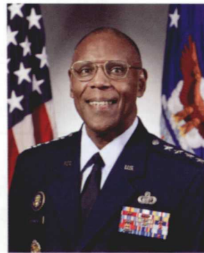
空军副总参谋长 拉里·斯宾塞 Larry O. Spencer Vice Chief of Staff