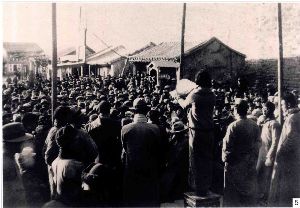
5 近 2000 名愤怒的学生在北平西直门外举行群众大会。张兆麟、陆瑾、赵志萱等许多人轮流用喇叭筒讲演，慷慨激昂。照片中持喇叭者为清华大学的陆瑾，其左是燕京大学的张兆麟。