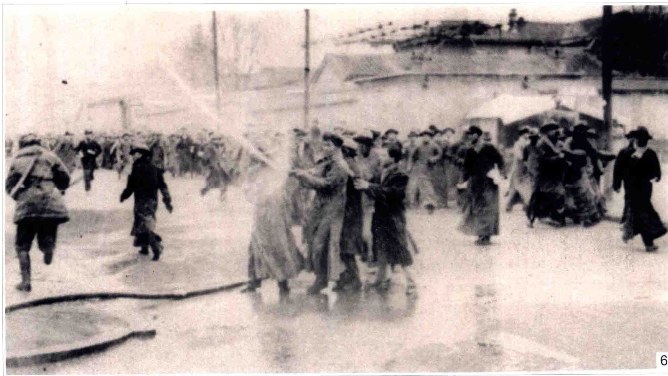
6 1935 年 12 月 16 日，北平城内的游行学生遭到当局镇压，他们英勇反抗，从军警手中夺过水龙头射向军警。