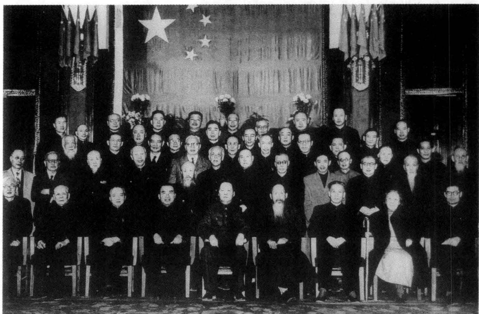
1949年10月1日，中央人民政府委员会部分委员合影。

一排左起：林伯渠、司徒美堂、李济深、朱德、毛泽东、张澜、刘少奇、何香凝、高岗。二排左起：陈铭枢、陈嘉庚、李锡九、董必武、沈钧儒、彭泽民、黄炎培、马叙伦、沈雁冰、高崇民、陈叔通、张难先。三排左起：谭平山、张治中、程潜、李烛尘、郭沫若、吴玉章、李立三、章伯钧、张东荪、徐特立、蔡廷锴。四排左起：邓小平、陈毅、张云逸、周恩来、赛福鼎·艾则孜、马寅初、陈云、彭真。五排左起：刘格平、刘伯承、薄一波、贺龙、聂荣臻、张奚若、傅作义、乌兰夫。