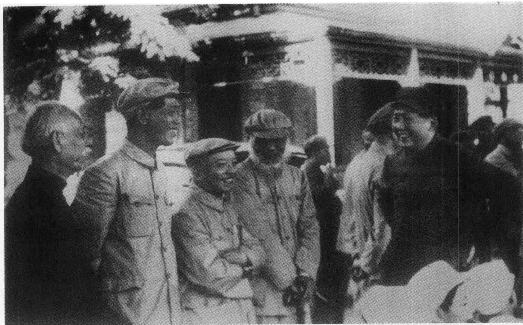
1949年8月28日，毛泽东与谭平山（右二）、李济深（右三）、蔡廷锴（右四）、彭泽民（右五）等在北平前门火车站迎候宋庆龄。