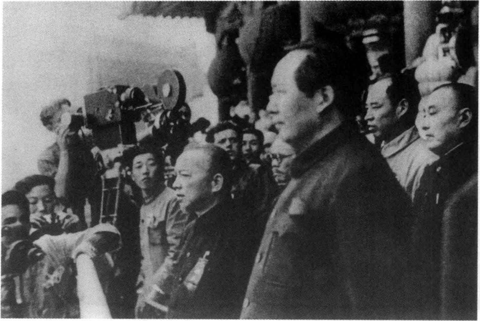
1949年10月1日，毛泽东、李济深、黄炎培、彭真等在天安门城楼上。