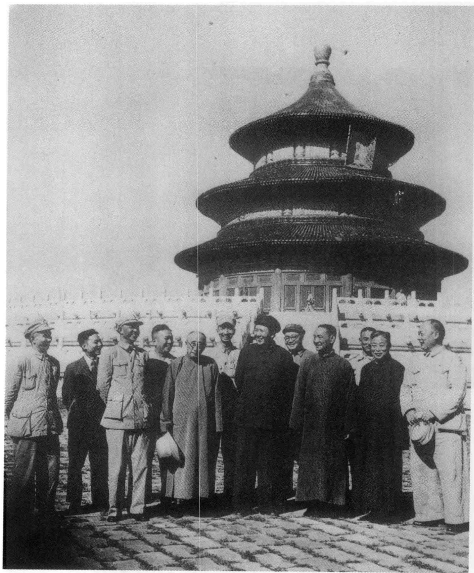
1949年9月19日,毛泽东同刘伯承(后排右二)、陈毅(前排右一)、粟裕(前排左一)邀请参加中国人民政治协商会议的部分国民党起义将领和民主人士游览北平天坛。前排右二李明扬、右三程潜、右五张元济、右六陈明仁;后排右三李明灏、右四程星龄。