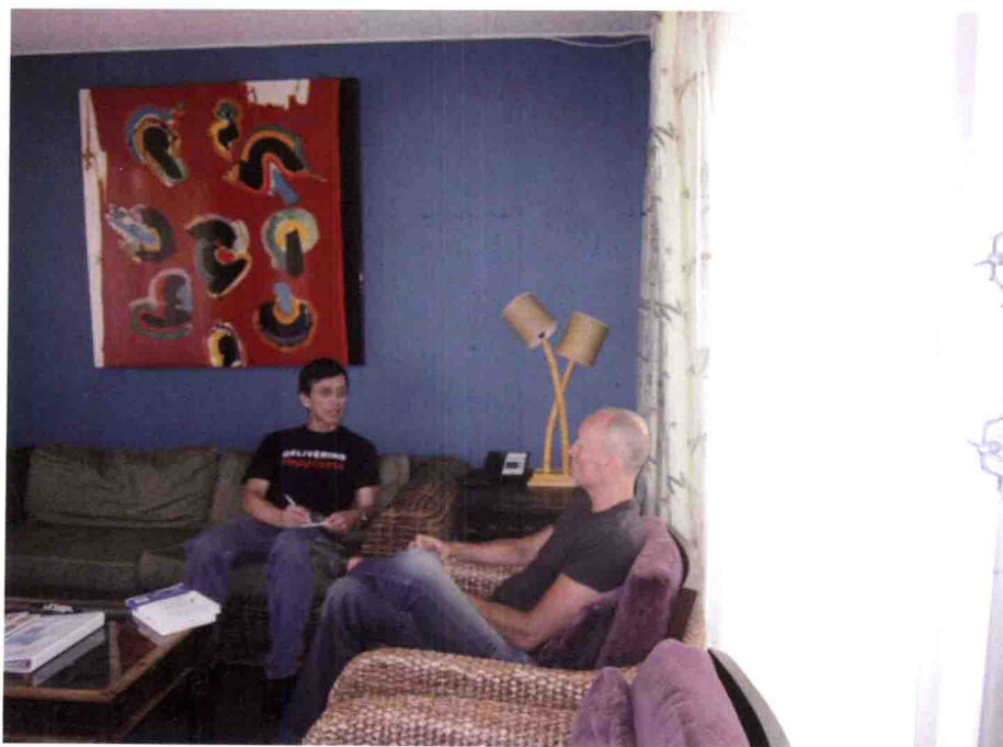
作者与译者讨论将此书翻译成中文的一些细节