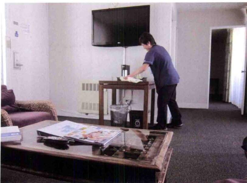
作者创办的第一家精品酒店的第一位清洁工至今仍在每天上班