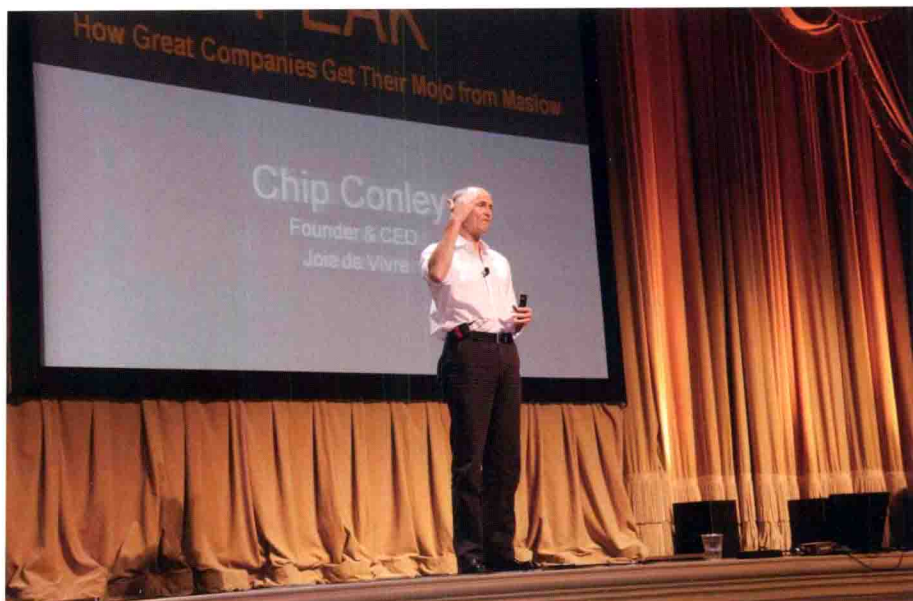
作者应美捷步公司首席执行官谢家华邀请向全体员工发表专题演说