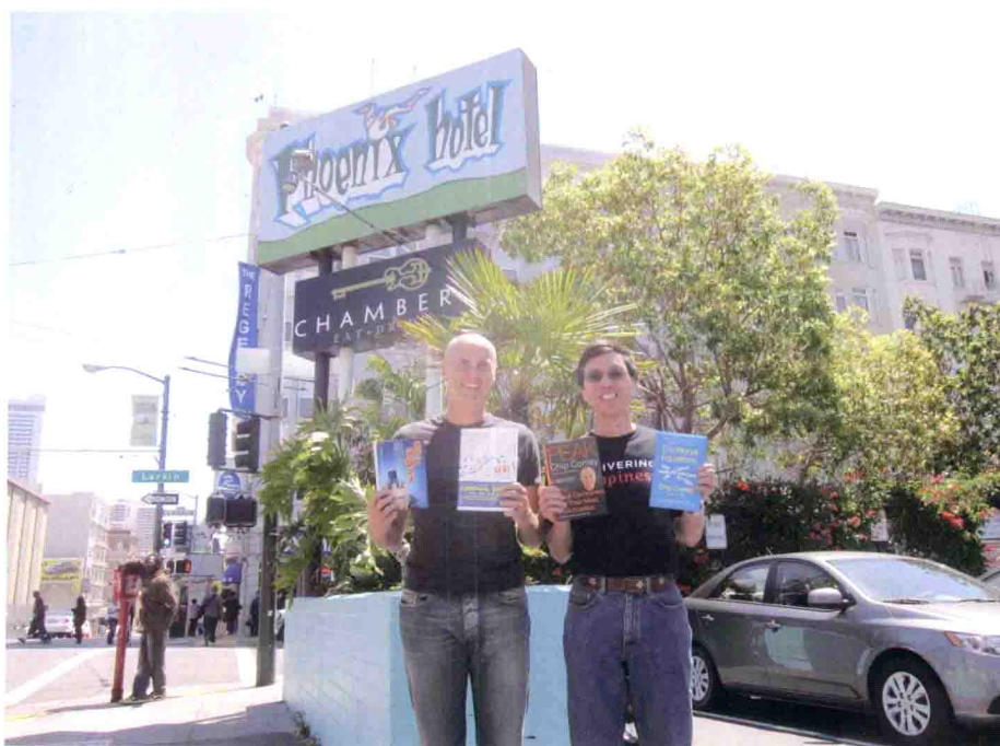
作者与译者在作者创办的第一家精品酒店前展示他们的作品