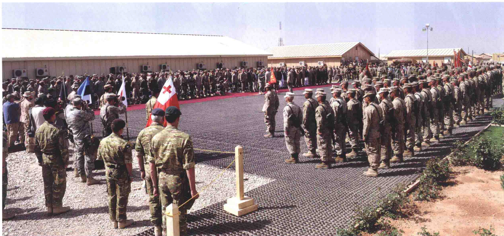
美国海军陆战队第2远征军完成在阿富汗的作战任务，举行任务交接仪式（2011年3月26日）

空地特遣队的最小规模包含1个加强步兵营和1个综合航空中队，称为“海军陆战队远征队(MEU)”；最大规模可包含1个陆战队师、1个航空联队和后勤补给单位，此时称为“海军陆战队远征军(MEF)”。