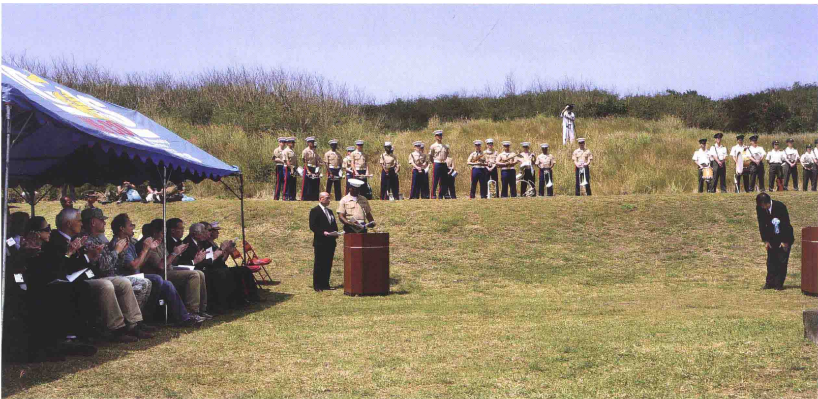
美国海军陆战队第 3 远征军士兵及美国二战老兵参加硫磺岛战役 67 周年的纪念仪式 (2012 年 3 月 14 日)

美国海军陆战队拥有 4 个陆战师: 第 1 海军陆战师位于加利福尼亚州的彭德尔顿; 第 2 海军陆战师位于北卡罗来纳州的勒琼; 第 3 海军陆战师位于日本冲绳的考特尼营; 第 4 海军陆战师为后备单位, 总部在路易斯安那州新奥尔良。