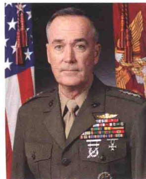
助理指挥官 约翰·帕克斯顿 Gen. John M. Paxton Assistant Commandant of the Marine Corps