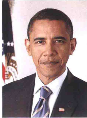
美国总统 奥巴马 Barack Hussein Obama U.S. President