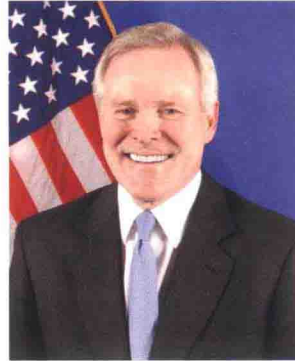
海军部长 雷·马布斯 Ray Mabus Secretary of the U.S. Navy