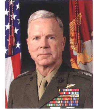
海军陆战队司令 詹姆斯·阿莫斯 General James F. Amos USMC Commandant of the Marine Corps