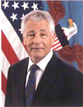
国防部长 查克·哈格尔 Chuck Hagel U.S. Department of Defense