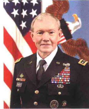
美军参谋长联席会议主席 马丁·登普西 Martin Dempsey Chairman of the Joint Chiefs of Staff