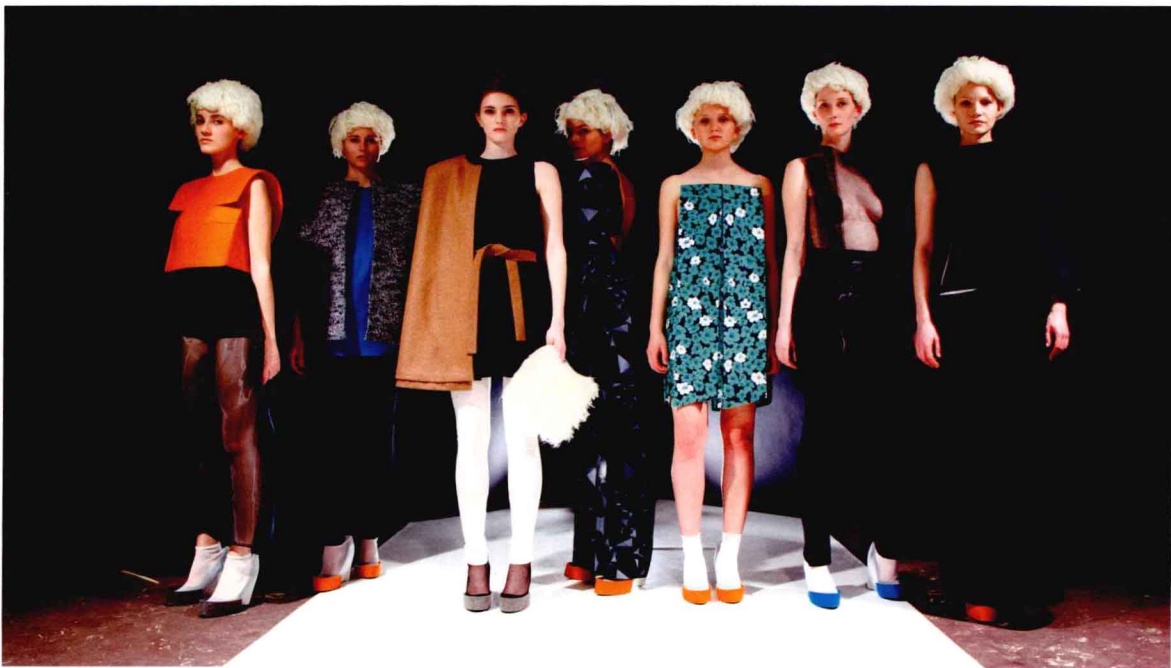
来自韦蕾娜·泽勒（Verena Zeller）所设计的一系列服装（见第158页的案例研究）

学术环境给学生提供了一个安全的环境，可以任由学生展开实验设计，毕业创作允许你自由地进行艺术创作。像这样的机会在服装职业氛围里就不大可能再有