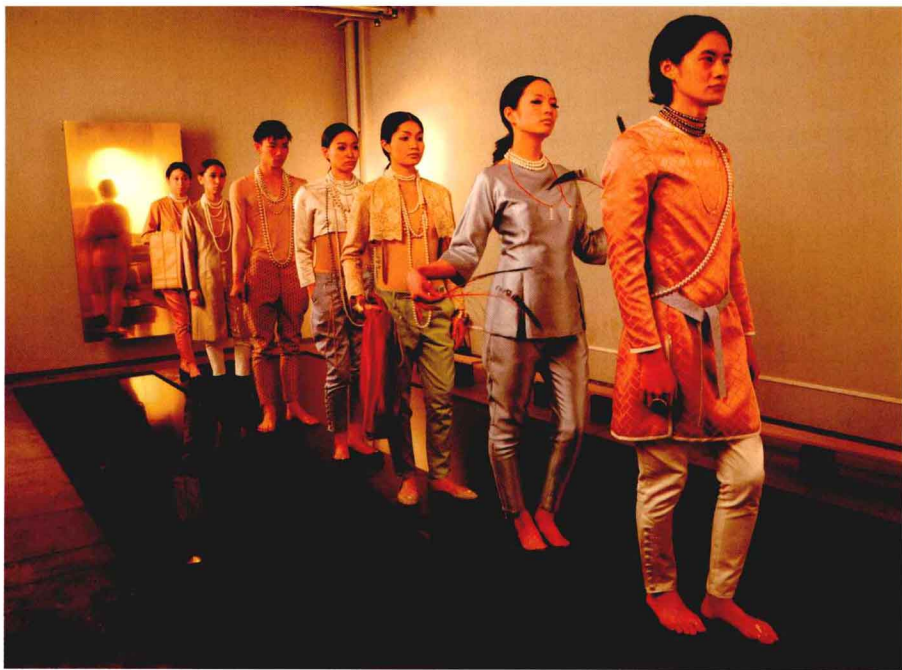
来自田中凉介（Kai Ryosuke）所设计的一系列服装

另一方面，你可以通过自己的毕业设计系列确立自己独立设计师的地位。有时候一些顶尖的精品店会支持刚毕业的年轻设计师，帮助他们推广、销售毕业设计作品，比如伦敦的Browns，这家店在1984年买下了约