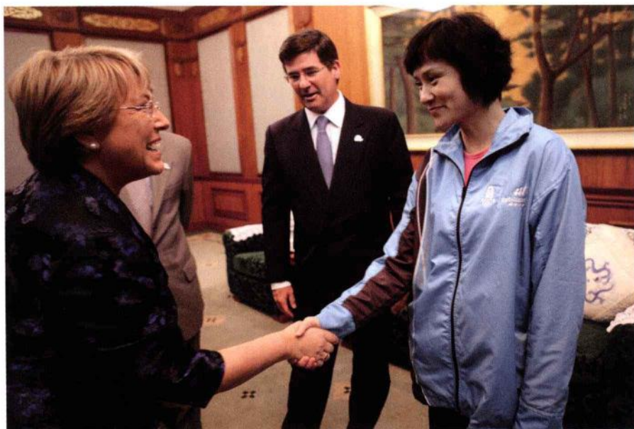
■ 2008年，我作为奥运大使在北京迎接时任智利总统的巴切莱特。