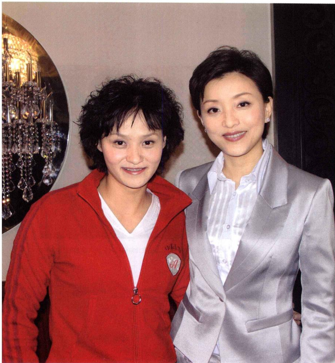
■ 我与杨澜一起参加以“真女人”为主题的金饰设计活动。