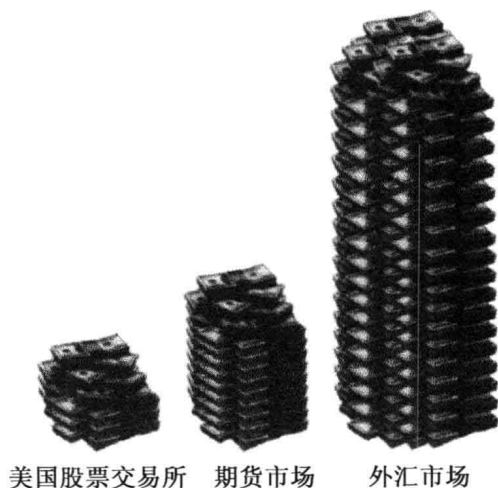
图1.1 外汇市场——不断发展中的市场