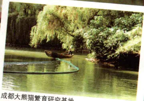
成都大熊猫繁育研究基地